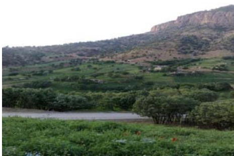
شکل شماره (۴): تصویری از باغ‌ها و مزارع کشاورزی منطقه نمونه گردشگری بازفت

۲- ۱- ۴- رودخانه بازفت: این رودخانه از دامنه کوه‌های منار، گله سگا، تورگ و زردکوه در ۱۲۰ کیلومتری شمال باختری شهرکرد سرچشمه می‌گیرد و در یک کیلومتری جنوب خاوری روستای کبوسی به رود کارون می‌ریزد. ارتفاع سرچشمه این رود ۲۷۵۰ متر، ارتفاع ریزشگاه آن حدود ۸۵۰ متر و شیب متوسط آن ۲ درصد است. رودخانه بازفت در حوزه منطقه نمونه گردشگری، چشم‌انداز بسیار زیبایی به وجود آورده به طوری که بسیاری از گردشگران، حاشیه این رودخانه را مکانی مناسب برای تفریح و تفرج خود می‌دانند. وجود رودخانه بازفت امکان ایجاد و توسعه ورزش‌های آبی و توسعه گردشگری بر پایه فعالیت‌های آبی از قبیل ماهیگیری، شنا و قایق سواری را بوجود آورده است و فرصت مناسبی پیش روی سرمایه‌گذاران نهاده است (مهندسین مشاور آمایش و توسعه البرز، ۱۳۸۹: ۷۵).