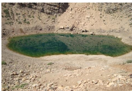
شکل شماره (۸): نمایی از چاه سبزان

۲-۱-۸- چاه سبزان: منطقه چاه سبزان در طول مسیر منطقه نمونه گردشگری بازفت، در فاصله ۴۵ کیلومتری چم قلعه قرار گرفته است و در مجاورت جاده آسفالتی قرار دارد. سبزی رنگ آب چاه دلیل نامگذاری آن به چاه سبزان است که در نوع خود زیبا و دیدنی می‌باشد. منشأ پیدایش آب چاه هنوز مشخص نشده و یکی از نکات قابل توجه در ارتباط با چاه سبزان، مشخص نبودن منشأ آن است. در مجاورت این چاه، پوشش گیاهی وسیعی از گون و خیش مورد وجود دارد که در پهنه مقابل چاه سبزان گسترده شده‌اند (همان، ۸۰).