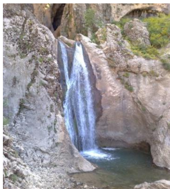
شکل شماره (۷): تصویری از حوضچه آبشار

۲-۱-۷- آبشار دره شیخ عالی: این آبشار در روستای دره شیخ عالی و در فاصله ۱۱ کیلومتری از روستای چم قلعه قرار دارد. منطقه‌ای که آبشار در آن واقع شده کاملاً کوهستانی بوده و بر فراز کوه‌های بلند آن، آبشار به پائین کوه سرازیر شده و منظره زیبایی بوجود آورده است. سایه‌سار درختان موجود در محل آبشار، مکان مناسبی برای استراحت گردشگران بوجود آورده است. در پایه آبشار، حوضچه‌هایی بوجود آمده که بر زیبایی آن افزوده است و قابلیت ایجاد مکان مناسبی برای شناکردن را بوجود آورده است (مهندسین مشاور آمایش و توسعه البرز، ۱۳۸۹: ۸۰).