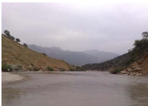
شکل شماره (۵): نمایی از رودخانه بازفت

۲- ۱- ۴- رودخانه بازفت: این رودخانه از دامنه کوه‌های منار، گله سگا، تورگ و زردکوه در ۱۲۰ کیلومتری شمال باختری شهرکرد سرچشمه می‌گیرد و در یک کیلومتری جنوب خاوری روستای کبوسی به رود کارون می‌ریزد. ارتفاع سرچشمه این رود ۲۷۵۰ متر، ارتفاع ریزشگاه آن حدود ۸۵۰ متر و شیب متوسط آن ۲ درصد است. رودخانه بازفت در حوزه منطقه نمونه گردشگری، چشم‌انداز بسیار زیبایی به وجود آورده به طوری که بسیاری از گردشگران، حاشیه این رودخانه را مکانی مناسب برای تفریح و تفرج خود می‌دانند. وجود رودخانه بازفت امکان ایجاد و توسعه ورزش‌های آبی و توسعه گردشگری بر پایه فعالیت‌های آبی از قبیل ماهیگیری، شنا و قایق سواری را بوجود آورده است و فرصت مناسبی پیش روی سرمایه‌گذاران نهاده است (مهندسین مشاور آمایش و توسعه البرز، ۱۳۸۹: ۷۵).