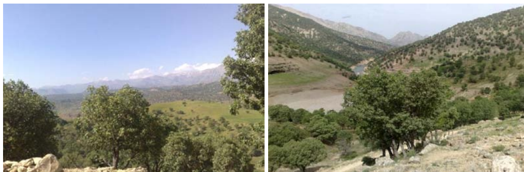
شکل شماره (۲): نمایی از کوه‌های منطقه نمونه گردشگری بازفت شکل شماره (۳): پوشش جنگل‌های بلوط منطقه نمونه گردشگری بازفت

۲-۱-۲- پوشش گیاهی و حیات وحش ۱ : پوشش گیاهی منطقه بازفت یکی از مهمترین جاذبه‌های آن است که برای گردشگران دیدنی و جذاب است. در این منطقه عوامل آب و هوا، نوع خاک و توپوگرافی، پوشش گیاهی متنوع و متفاوتی بوجود آورده است. بخش اعظمی از جنگل‌های منطقه بازفت را درختان بلوط در بر گرفته که چشم‌انداز زیبایی به آن بخشیده است. این جنگل‌ها در برخی نقاط از تراکم بیشتری برخوردارند. پوشش گیاهی جنگل و مرتع و قرارگیری در حاشیه رودخانه، به جذابیت بازفت افزوده است. علاوه بر بلوط در کوه‌های منطقه انواع دیگری از درختان مانند زبان گنجشک، پسته وحشی، زالزالک، گردو و... وجود دارد. منطقه بازفت به علت دارا بودن فضای کوهستانی و جنگلی، پوشش گیاهی متنوع، چشمه‌ها و رود بازفت، استعداد خوبی برای زندگی انواع جانوران دارد. از انواع وحوش و پرندگان موجود در این منطقه می‌توان قوچ، میش، کل، بز، کبک دری، کبوتر و... را نام برد (مهندسین مشاور آمایش و توسعه البرز، ۱۳۸۹: ۷۳).