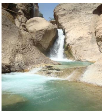
شکل شماره (۶): آبشار دم تنگ روستای تبرک علیا

۲-۱-۷- آبشار دره شیخ عالی: این آبشار در روستای دره شیخ عالی و در فاصله ۱۱ کیلومتری از روستای چم قلعه قرار دارد. منطقه‌ای که آبشار در آن واقع شده کاملاً کوهستانی بوده و بر فراز کوه‌های بلند آن، آبشار به پائین کوه سرازیر شده و منظره زیبایی بوجود آورده است. سایه‌سار درختان موجود در محل آبشار، مکان مناسبی برای استراحت گردشگران بوجود آورده است. در پایه آبشار، حوضچه‌هایی بوجود آمده که بر زیبایی آن افزوده است و قابلیت ایجاد مکان مناسبی برای شناکردن را بوجود آورده است (مهندسین مشاور آمایش و توسعه البرز، ۱۳۸۹: ۸۰).