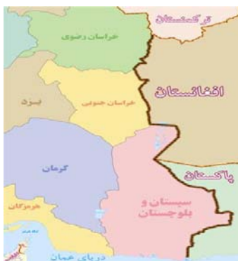
نقشه شماره ۱) نقشه مرزهای سیاسی ایران با پاکستان و افغانستان