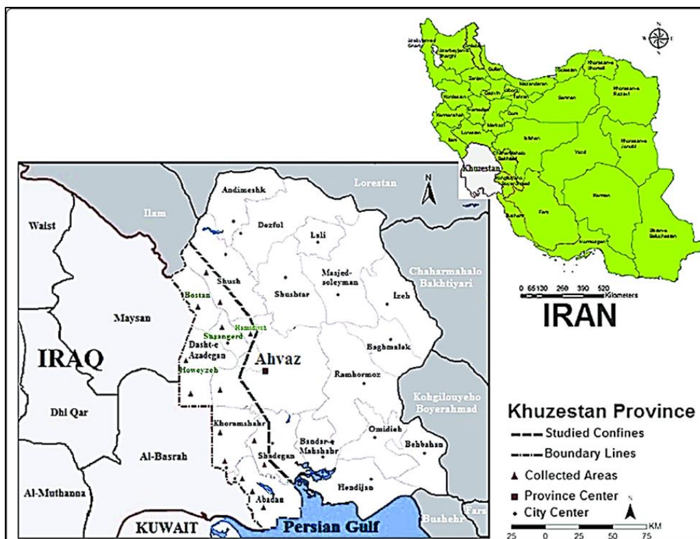
نقشه ۲: موقعیت شهر اهواز در استان خوزستان

رودهای خوزستان عبارتند از: کارون - کرخه - دز - مارون و هندیجان زهره • میانگین بارندگی در استان خوزستان طی سالهای ۱۳۳۰ تا ۱۳۶۵ در اهواز ۱۹۹ میلیمتر بوده است • اکثر مردم فارسی و عشایر مقیم و بومی خوزستان به عربی و بختیاری، لری و لهجه دزفولی، شوشتری و ترکی صحبت می کنند. از نظر تقسیمات کشوری و جغرافیایی این استان شامل ۱۶ شهرستان ۲۸ شهر ۲۶ بخش و ۱۱۱ دهستان می باشد. شهرهای خوزستان عبارتند از: اهواز مرکز استان - آبادان - ایذه - بندر ماهشهر - بهبهان - خرمشهر - دزفول - سوسنگرد - رامهرمز شوشتر - مسجد سلیمان - اندیمشک - باغمک - شادگان - شوش - امیدیه • حضور فعال ۸ هزار ساله دولتهای باستانی ایلام هخامنشیان، اشکانیان، ساسانیان و اعراب و مسلمانان سیراقوام را می توان از آثار و یادمانهای باستانی بجای مانده در شهرهای ایذه - مسجد سلیمان - شوش و شوشتر - هفت تپه بهبهان اهواز دریافت • چغازنبیل در نزدیکی هفت تپه و کاخ اپادانا در شوش و کول فره در ایذه از دبدنی ترین آثار باستانی و مقبره دانیال نبی در شوش از زیارتگاههای مهم به شمار می آید در خصوص وجه تسمیه اهواز گفته اند، اهواز جمع عربی کلمه مفرد هوز = حوز است که ابتدا به یک قبیله از آن اطلاق می شده و ایرانیان آن را به عنوان ایالتی برای تعیین ناحیه قدیم ایلام به کار بردند که به آن کرسی ایالت خوزستان نیز گفته می شده است. نام قدیم آن هرمز دار در شیر و پس از آن سوق الاهواز و در عهد قاجاریه آن را ناصری یا ناصریه نامیده اند در سال ۱۳۱۴ هجری شمسی اهواز نامیده شد اردشیر سد بزرگی بر کارون نهاد در عصر وی وجانشینانش، این شهر رونق و اعتبار فراوان داشت و به جای شوش پایتخت سوزیانا یا خوزستان گردید (Hosseini Kohnouj et. al. 2015).