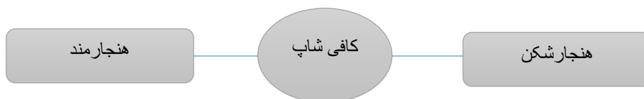
شکل ۲: تیپولوژی کافی‌شاپ‌های بندرعباس

همانگونه که اشاره شد شهر بندرعباس دارای کافی‌شاپ‌هایی است که به نحوی نسبت به جامعه و نظام کنونی حاکم بر آن، هنجارشکن هستند و از آنها با عنوان کافه‌های هنجارشکن نام برده شد. در این کافی‌شاپ‌ها آنچه اساس و پایه‌ی رونق است، قلیان است. از طرف دیگر آنچه در کافه‌های سنتی و قهوه‌خانه‌ها از گذشته تا به امروز رواج داشته و نقش مهمی در استحکام قهوه‌خانه‌ها داشته، همین قلیان بوده است اما آنچه جالب به نظر می‌رسد نفوذ این بعد از سنت در فضای مدرن کافی‌شاپ است. در واقع قلیان، سنت و مدرنیته را در فضای کافی‌شاپ ادغام ساخته است. کافی‌شاپ مدرن کنونی با وجود داشتن هنر و سبکی مدرن، قلیان را به عنوان یکی از مهم‌ترین عناصر خود، در فضای کنونی‌اش جای داده است. در واقع استعمال قلیان می‌تواند به خودی خود یکی از بنیادی‌ترین اهداف کافه‌روها برای حضور در کافی‌شاپ‌های هنجارشکن باشد.