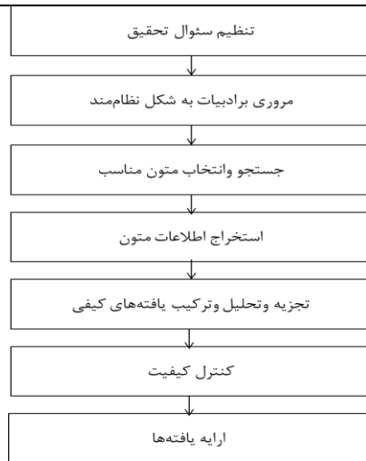
شکل ۱: مراحل پیاده‌سازی روش فراترکیب

جامعه آماری این پژوهش شامل کلیه پژوهش‌های انجام‌گرفته در حوزه مشارکت شهروندان است که از طریق سامانه جستجوی کتابخانه‌ها و پژوهشکده‌هایی چون جهاد دانشگاهی (SID)، پایگاه نشریات کشور (مگیران) و ایران‌داک، با کلمه مشارکت اجتماعی، مشارکت در امور شهری و مشارکت در قسمت عنوان و محدود کردن جستجو به زبان فارسی و محدوده سال‌های ۱۳۹۰ تا ۱۴۰۰ جمعاً ۱۹ پژوهش پذیرفته‌شده، به دست آمد.