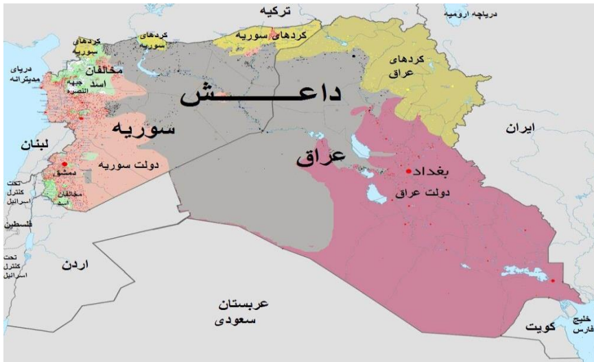
نقشه ۳: مناطق تحت تصرف داعش