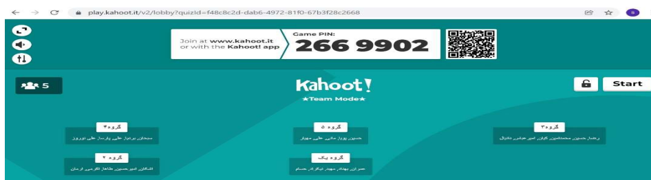
شکل ۲. گروه‌بندی دانش‌آموزان در حالت تیم مد پلتفرم کاهوت

سازمان‌دهی کلاس درس بر مبنای سطوح پیشرفت تحصیلی دانش‌آموزان در دسته‌های ۵-۶ نفره گروه‌بندی شکل گرفت. از دو رویکرد یادگیری مشارکتی (تقسیم به گروه‌های نامتجانس پیشرفت تحصیلی و گروه‌های بازی-مسابقه) در فرآیند پژوهش استفاده شد. دانش‌آموزان هر گروه با توجه به نقشه محتوایی، بخشی از کتاب را قبل از کلاس مطالعه می‌کردند و نکات موردنظر را در گروه واتساپی به اشتراک می‌گذاشتند که زمان کلاس درس هم به جمع‌بندی نهایی می‌رسیدند و نتیجه هر گروه گزارش می‌شد و گزارش نهایی گروه‌ها نقد و بررسی می‌شد.