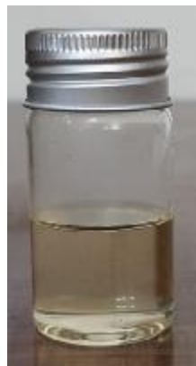
شکل ۲- نانوامولسیون پودر بره موم

نانو امولسیون تهیه شده با استفاده از پودر بره موم و ساپونین (به عنوان امولسیفایر)، تحت شرایط آب مادون بحرانی در شکل (۲) نشان داده شده است.