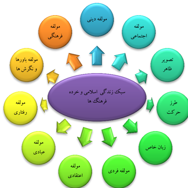
شکل ۲: طراحی مدل سبک زندگی اسلامی

در پایان نتایج حاصل از فراترکیب (مولفه‌ها) در قالب یک مدل مفهومی ارائه شده است (جدول ۳) در این مدل ۱۲ مقوله سبک زندگی اسلامی و خرده فرهنگ‌ها (دینی، رفتاری، عبادی، باورها و نگرش‌ها، فرهنگی، اجتماعی، اعتقادی، فردی، تصویر ظاهر، طرز حرکت و زبان) برای طراحی مدل ترسیم شده است که این مولفه‌ها همگی بروی طراحی مدل سبک زندگی اسلامی و خرده فرهنگ‌ها تاثیر زیادی دارند.