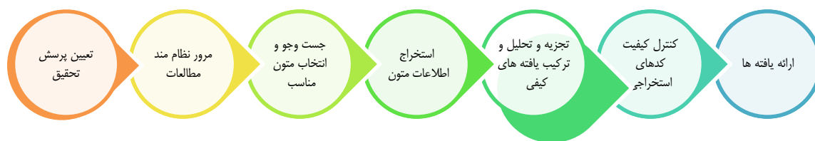
شکل ۱: فرآیند هفت مرحله‌ای فراترکیب سندلوسکی و بارسو (۲۰۰۷)