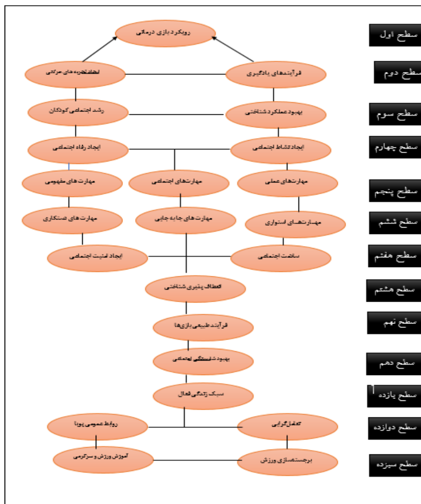
شکل ۱: مدل بازی‌های بومی محلی انطباقی با رویکرد توسعه امید اجتماعی