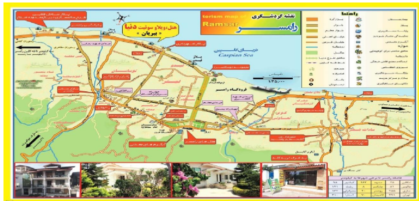
شکل شماره (۲). نقشه کاربری زمین و موقعیت فضایی شهر رامسر.

دریا و جنگل این منطقه را به عنوان قطب مهم گردشگری در کشور و حتی جهان مطرح کرده است. آب و هوای این منطقه جلگه‌ای معتدل، مرطوب و کوهستانی سرد و نیمه مرطوب است و اقتصاد آن بر پایه کشاورزی، دامداری و صنعت گردشگری استوار می‌باشد. وجود فرودگاه در شهر رامسر، و جنگل در شهرستان رامسر در غرب مازندران از دیگر ویژگی‌های این منطقه محسوب می‌شود (به نقل از مرکز آمار ایران).