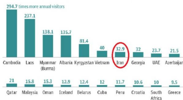
شکل ۲- نمودار مقایسه بیشترین رشد گردشگر خارجی از سال ۱۹۹۰ تا سال ۲۰۱۷ میلادی

محدوده مورد مطالعه این پژوهش شامل کشور ایران می‌باشد. ایران به لحاظ موقعیت جغرافیایی در جنوب غربی آسیا و در منطقه خاورمیانه قرار دارد و دارای منطقه ویژه اقتصادی، توریستی و فرهنگی می‌باشد. کشور ایران پس از کامبوج، لائوس، میانمار، آلبانی، قرقیزستان و ویتنام در رتبه هفتم بیشترین رشد، در جذب گردشگر از سال ۱۹۹۰ میلادی تاکنون قرار گرفته است. مقایسه بیشترین رشد گردشگر خارجی از سال ۱۹۹۰ تا سال ۲۰۱۷ میلادی در نمودار زیر مشخص گردیده است (شکل شماره ۲).