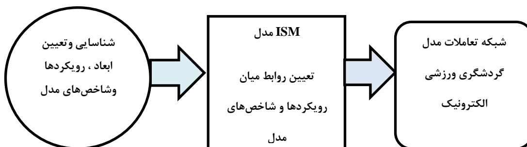
شکل ۱- مدل مفهومی تحقیق