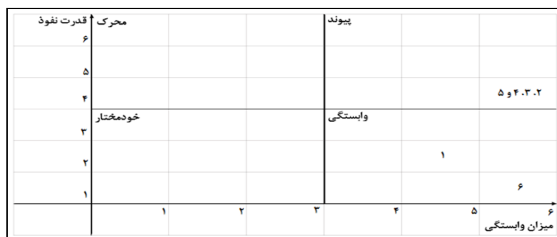
شکل ۴- دستگاه مختصات قدرت نفوذ و میزان وابستگی پژوهش

بر اساس ستون قدرت نفوذ و سطر میزان وابستگی، آن را روی دستگاه مختصات نمایش می‌دهند که از چهار ناحیه خود مختار، وابستگی، محرک و پیوند تشکیل شده است (فیروزجائیان، ۱۳۹۲). همچنین می‌توان به تحلیل میک مک عوامل درون یک سیستم پرداخت که بر اساس ماتریس دستیابی نهایی پژوهش بدست آمده است (شکل شماره ۴).