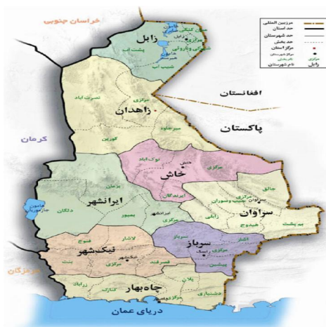
نقشه شماره ۱: شهرهای استان سیستان و بلوچستان

سیستان و زابل امروزی به قسمت شمالی استان سیستان و بلوچستان اطلاق می‌شود. آثار به دست آمده از خرابه‌های شهر سوخته در ۵۵ کیلومتری جاده زابل به زاهدان قدمت فرهنگ و تمدن را در این سرزمین به ۳۲۰۰ ق.م می‌رساند. خرابه‌های کاخ‌های هخامنشی در کوه خواجه و دهانه غلامان و خرابه‌های آتشکده کرکویه و ده‌ها آثار باستانی باقی مانده سیستان را به بهشت باستان‌شناسان تبدیل کرده است. (تاریخ سیستان، ۱۳۱۵: ۱۰۰).