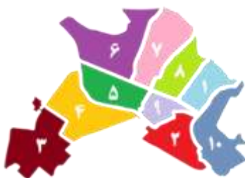
شکل ۲: مناطق شهرداری در شهر کرج

با توجه به وضعیت فعلی شهر کرج میزان پسماند تولیدی این شهر ، بعنوان پارامتر " میزان پسماند تولیدی " انتخاب گردید . گستردگی مناطق شهری باعث شده است تا شهر کرج به ۱۰ منطقه شهرداری تقسیم گردد.