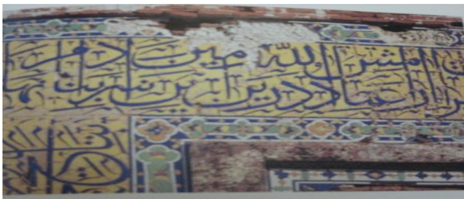
شکل از مجموعه بگلی