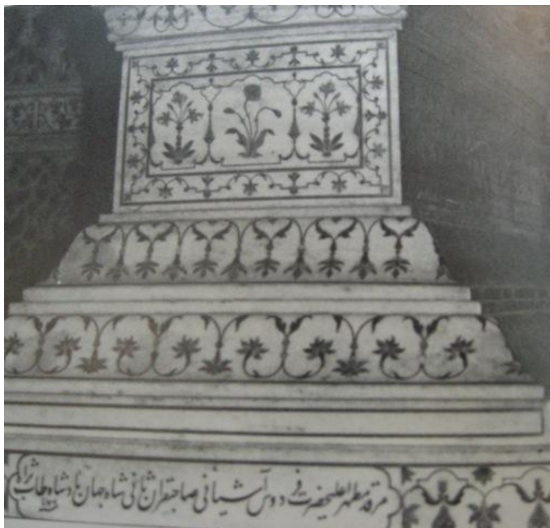
شکل از مجموعه بگلی

(Bordeaux) به عنوان مرصع کار و سنگ نشان (جواهرنشان) نام می‌برند (هوک، ۱۳۷۵: ص ۲۲۶). به نقل از نسخه خطی که از قرن هفدهم به جای مانده، مؤلف از ۳۶ نوع سنگ از جمله سنگ غوری، سرخ، پای زهر، خارا، بلور لاجورد، سلیمانی، یمینی، یاقوت، زمرد، رخام، فیروزه، مغناطیس و ... نام برده و در یک جدول که ابعاد مختلف این سنگ‌ها ذکر کرده است، همچنین در جدولی دیگر به چوب‌های مورد نیاز مانند صندل و آبنوس اشاره نموده است. استفاده از سنگ‌های قیمتی و نیمه قیمتی بر روی مرمر سفید (پرچین کاری) امری است که تا قبل از ورود مسلمانان به هند در معماری هند سابقه نداشته است. به هر حال گفته می‌شود برای ساخت این بنا از بیست هزار استاد کار، معمار، سنگ‌تراش، جواهرتراش، فلزکار، نقاش و کارگر استفاده شده که حدود دو دهه مشغول بودند و نتیجه تلاش آن‌ها اثری کامل، عالی و نمونه اصیلی از معماری اسلامی به شمار می‌رود.