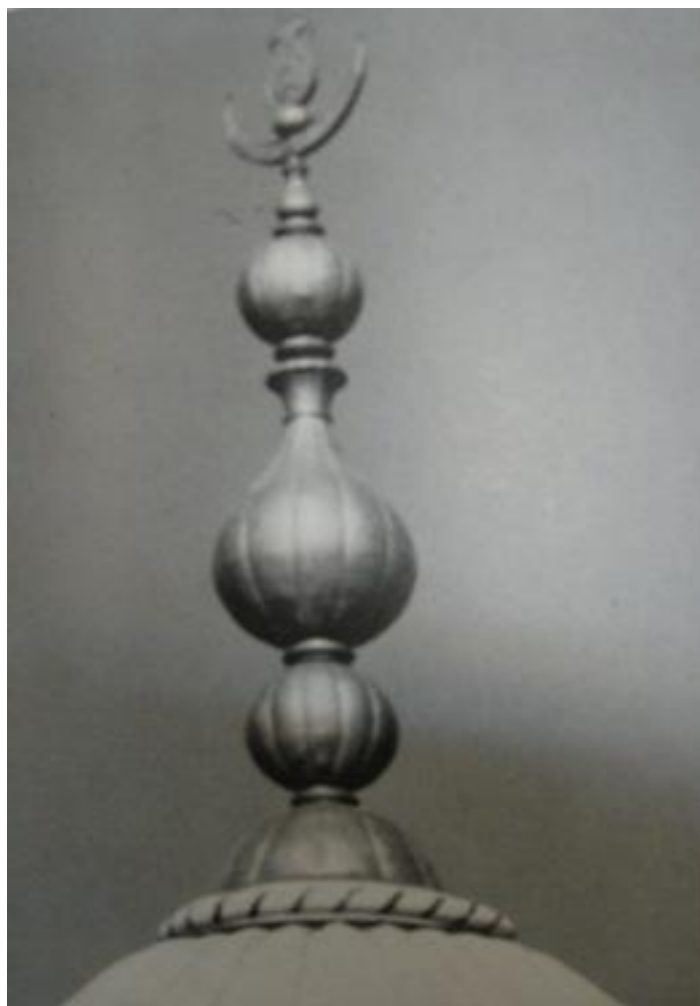
شکل از مجموعه بگلی

آنچه که موجب شده ارتفاع آن مشخص تر شود این چهار گنبد یا چتری کوچکتر تأکیدی بر عظمت گنبد بزرگ است. پایه‌های ستونی که بر پشت بام مقبره قرار دارد و از آنجا نور داخل نیز تأمین می‌گردد. تزییناتی که بر روی آن‌ها انجام شده ترکیبی از عناصر تزیینی سنتی ایرانی و هندی است. تارگ گنبد اصلی از طلا ساخته شده بود که تا اوایل قرن ۱۹ میلادی نیز وجود داشت. اما اکنون از برنز ساخته شده است. این نشان شامل یک ماه که سمبل و نماد اسلامی است و یک چنگک سه شاخه که نماد هندوان و سمبل شیوا (خدای هندوان) است.