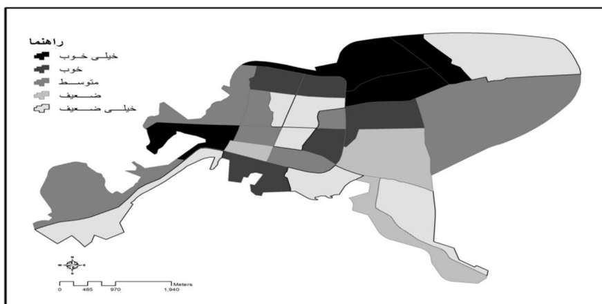
نقشه شماره ۳-رتبه بندی محلات شهر مراغه براساس شاخص های کیفیت زندگی با استفاده از طیف رنگی بازسازی: نگارندگان، ۱۳۸۹