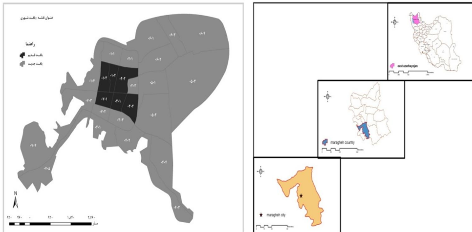
نقشه ۱- موقعیت شهر مراغه

شهر مراغه یکی از قدیمی ترین شهرهای ایران است. این شهر در زمان استیلای مغول توسط هلاکو خان به عنوان پایتخت کشور ایران انتخاب شد. این شهر در ۳۷ درجه و ۲۳ دقیقه عرض شمالی و ۴۶ درجه و ۱۶ دقیقه طول شرقی واقع شده است و ارتفاع آن از سطح دریا ۱۳۹۰ متر می باشد. شهر مراغه به وسعت تقریبی ۲۶۴۷ هکتار در امتداد رودخانه‌ی صوفی چای و در دامنه های جنوبی کوه سهند واقع شده است. جمعیت شهر طبق سرشماری سال ۱۳۸۵، معادل ۱۴۹۹۲۹ هزار نفر بوده است. ۲۹۸۰۹ نفر که تقریباً ۲۰ درصد جمعیت شهر مراغه را شامل می شود، در بافت قدیم یا تاریخی این شهر زندگی می کنند، این شهر به لحاظ ساختاری تقریباً شطرنجی است و بافت قدیمی دارای بافتی تقریباً ارگانیک می باشد. هم اکنون شهر مراغه دارای ۲۶ محله و ۷ ناحیه می باشد.