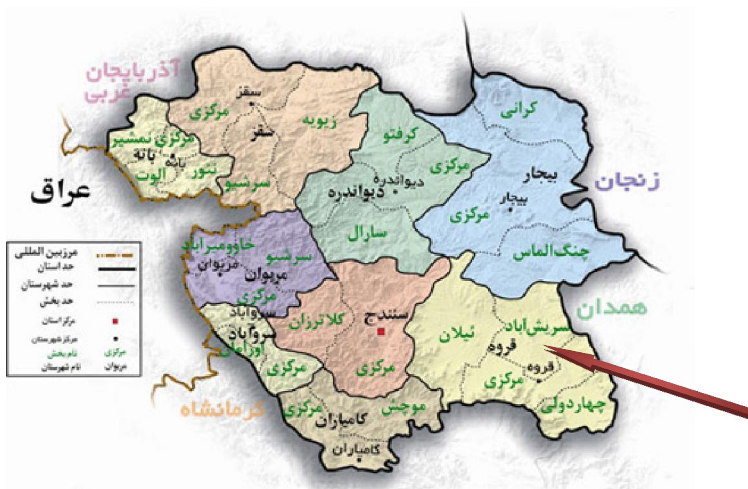
تصویر شماره ۱- موقعیت شهر سریش آباد در استان کردستان

روستاهای قصلان و زیویه، از جنوب با روستای مظفرآباد و اراضی عرفی قروه، از غرب با روستاهای آونگان، شیخ تقه و چهارگاه و بالاخره از شمال غربی با روستاهای شوراب حاجی و شوراب خان همجوار است. این شهر بر سر راه آسفالتی قروه- بیجار واقع شده است. این شهر توسط ۷ کیلومتر جاده‌ی آسفالتی به جاده‌ی اصلی همدان- سنندج و شهر قروه (مرکز شهرستان) متصل است و در مجموع فاصله‌ی زمینی آن از سنندج ۱۰۰ کیلومتر می‌باشد (مهندسین مشاور پرویس شهر معماری و شهرسازی، ۱۳۸۵ و مرکز آمار ایران، ۱۳۹۵).