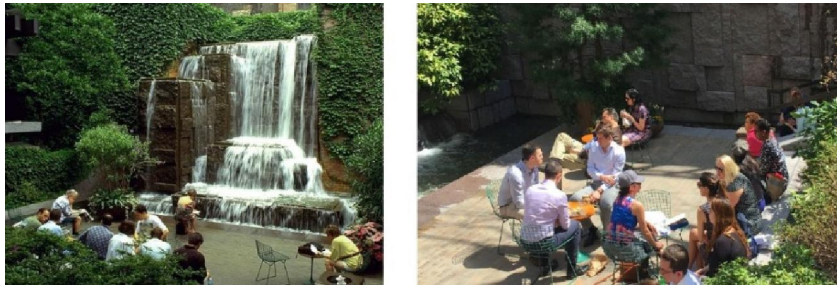
تصویر ۲: پارک گرین‌اگر و شکل‌گیری تعاملات اجتماعی در گروه‌های دو تا چهار نفره