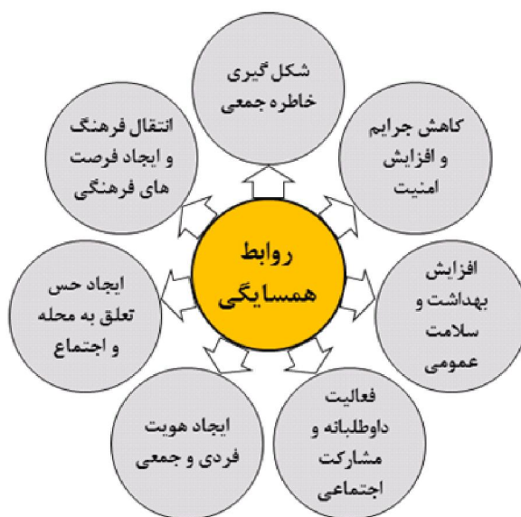
شکل ۲: آثار مثبت توسعه روابط همسایگی در بسترهای طبیعی و فضاهای سبز منبع: (صادقیان، ۱۳۸۳؛ توسلی، ۱۳۶۲؛ نوذری، ۱۳۸۳؛ مطلبی، ۱۳۸۳؛ میرمقنایی، ۱۳۸۸)

تجارب خارجی در ارتباط با تأثیری که طبیعت و فضاهای سبز شهری می‌توانند بر تعاملات همسایگان داشته باشند می‌توان به این نمونه‌ها اشاره کرد: مطالعه شورای بهداشت هلند نشان می‌دهد استفاده از فضاهای سبز و طبیعت شهری با ارتباطات و پیوندهای اجتماعی همبستگی مثبتی دارد. مطالعه‌ای در انگلیس، نشان می‌دهد که بوستان‌ها فضایی برای گرد هم آمدن اجتماعات مختلف فراهم می‌کنند. علاوه بر این، این‌گونه فضاها فرصتی را برای ارتباط منظم غیررسمی افراد و گروه‌های مختلف فراهم می‌کند (Dines et al, 2006)، مطالعه دیگری در انگلستان نشان می‌دهد افراد در پارک‌ها و بوستان‌های عمومی با یکدیگر به صورت غیررسمی و صمیمی‌تر رفتار می‌کنند. جرمن، کیاری و سیلند (۲۰۰۴) به ایجاد کنش متقابل و انسجام اجتماعی بین طبقات اجتماعی به عنوان کارکرد اجتماعی فضاهای سبز شهری اشاره کرده‌اند. همچنین رابطه مثبتی بین یکپارچگی اجتماعی افراد محله و قرار گرفتن در معرض فضاهای سبز مشترک وجود دارد. احداث باغ‌های شهری یا محلی اغلب ابزاری برای بهبود اجتماعات محلی و گذاران اوقات فراغت و تفریح در نظر گرفته می‌شود. باغ‌های محلی باعث بهبود نگرش ساکنان به محله خود و تقویت سازمان‌دهی محلی و شبکه‌های اجتماعی همسایگی می‌شود (Scotland Greenspace, 2008: 24).