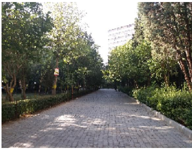
تصویر ۶: وضعیت طبیعت و فضاهای سبز در اکباتان

رضایت از طبیعت موجود در مجتمع مسکونی است. در اکباتان وجود عناصر طبیعی و فضاهای سبز بر ساختمان‌های مجتمع احاطه و چیرگی یافته و تنوع و چشم‌انداز بصری زیبایی را ایجاد کرده است. در حالی که در پردیسان وضعیتی کاملاً متضاد با اکباتان شکل گرفته است و شاهد تسلط کامل سیمان و سنگ و فضاهای خشن در سیمای بصری مجتمع هستیم که قادر به ایجاد هیچ‌گونه شادابی، سرزندگی و روابط همسایگی برای ساکنان نیست. ساختمان‌ها کاملاً مسلط بر فضاهای طبیعی و سبز هستند و هیچ‌گونه ابتکاری در تنوع، زیبایی و شادابی فضاهای طبیعی این مجتمع صورت نگرفته است که مسلماً ساکنان را از داشتن محیطی سرزنده، و محیط را از داشتن ساکنانی سرزنده همراه با روابط و تعاملات همسایگی و اجتماعی پویا محروم می‌کند.