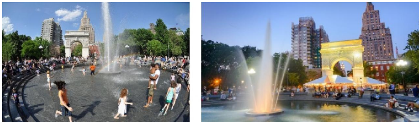
تصویر ۱: پارک واشینگتن و دو عنصر اصلی آن (فواره و طاق‌نمای ورودی) برای تعاملات ساکنان

پارک واشینگتن: این پارک با مساحت حدود ۳۹۵۰۰ مترمربع، یکی از مکان‌های معروف شهر نیویورک است که با استقبال ساکنان شهر و جهانگردها به عنوان فضای عمومی موفق شناخته شده است. آب‌نمای مرکزی به عنوان عنصری طبیعی و طاق‌نمای ورودی شمالی، دو ویژگی شاخص این پارک هستند که در محور اصلی پارک در ارتباط مستقیم با یکدیگر قرار گرفته‌اند (تصویر ۱). تعریف این دو عنصر شاخص در ارتباط مستقیم با یکدیگر، زمینه‌ای برای جمع شدن ساکنان و افزایش تعاملات ایجاد کرده است (سوزنچی و تریوه، ۱۳۹۰: ۱۱۶).