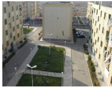
تصویر ۵: وضعیت طبیعت و فضاهای سبز در پردیسان