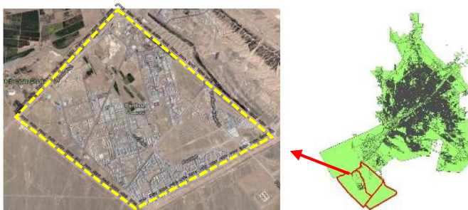
شکل ۷: محدوده جغرافیایی مجتمع مسکونی پردیسان قم

مؤسسان این شهرک بود اما روند شکل‌گیری آن در سال‌های گذشته رضایت کامل مردم را جلب نکرده است و کمبود فضای سبز یکی از عمده‌ترین مشکلات این مجتمع به شمار آید.