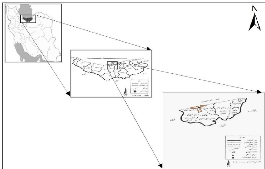
شکل ۱- موقعیت جغرافیایی شهر مورد مطالعه