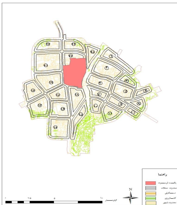
شکل (1): موقعیت شهر آمل در استان مازندران