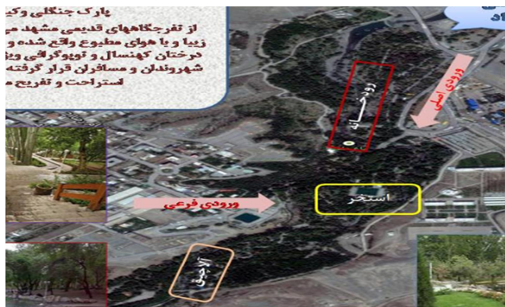
شکل (۳): موقعیت و امکانات پارک وکیل آباد با کاربری همراهی با طبیعت (نگارندگان)

همراهی با کودکان و دادن فرصت به آنها برای ارتباط نزدیک با طبیعت که کمترین مخاطرات انسانی و طبیعی را به همراه داشته باشد، از جمله انگیزه‌هایی بود که شرکت کنندگان در این تحقیق برای مراجعه به پارک‌های مورد بررسی اعلام کرده بودند. به طوری که یافته‌های به دست آمده نشان داد که تقریباً ۱۹/۸ درصد از پاسخ دهندگان، یکی از اهداف اصلی خود از بازدید پارک‌های مورد اشاره را همراهی با کودکان در محیط‌های امن و سالم عنوان نموده بودند. در این شرایط پارک‌ها در کنار سایر عملکردها، ابعاد اجتماعی، تقویت روابط خانوادگی و ارائه شرایط امن و سالم برای حضور و بازی کودکان در اختیار قرار می‌دهند. شرایطی که در شهرهای شلوغ، پرتراکم و آلوده به شدت کمیاب و در مواردی به طور کلی نایاب است.