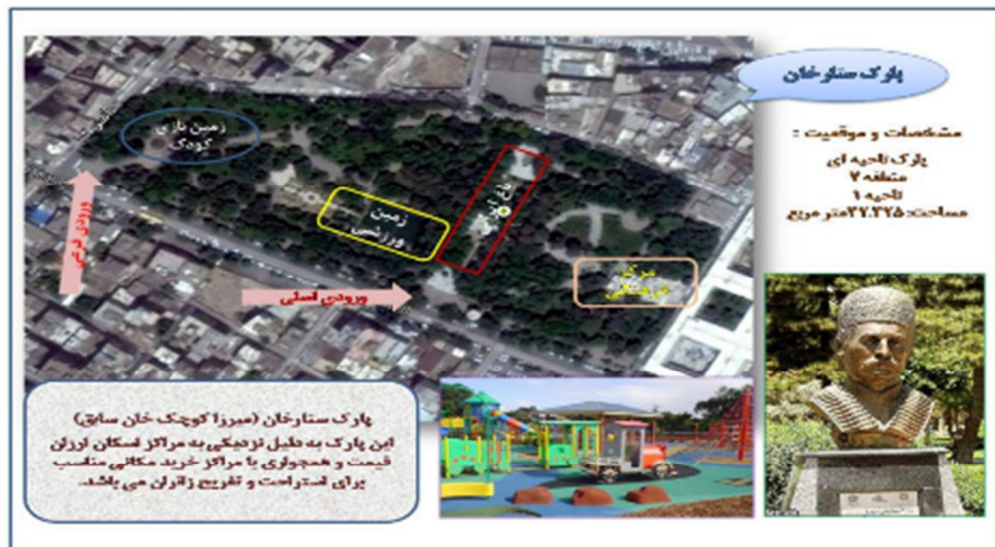
شکل (۶): موقعیت و امکانات پارک ستارخان با کاربری استراحتگاهی و برخی عملکردهای هنری (نگارندگان)