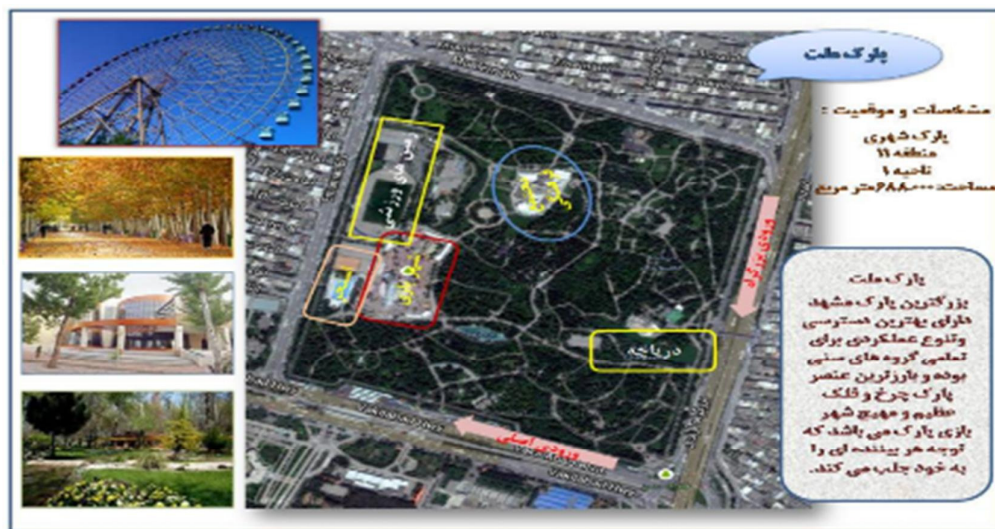
شکل (۵): موقعیت و امکانات پارک ملت با کاربری همراهی با کودکان و عملکردهای ترکیبی (نگارندگان)

همراهی با کودکان، تفکر و تعمق درباره طبیعت و... باشند، را انگیزه اصلی عنوان می‌کنند. به همین دلیل پارک‌هایی که این انگیزه‌ها را توامان تامین می‌کنند، بیشتر از سایر پارک‌ها مورد بازدید مردم قرار می‌گیرند (شکل شماره ۴). نیازهای عاطفی و نقش وجود عملکردهای تامین کننده آن در پارک‌ها: در بررسی‌های مربوط به پارک‌ها و فضاهای طبیعی موجود در شهر، کمتر محققان به وجود تاسیسات و تجهیزاتی که تامین