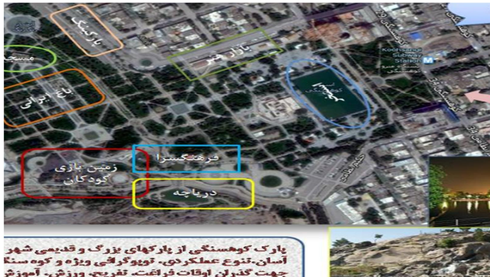
شکل (۴): موقعیت و امکانات پارک کوهسنگی با کاربری خلوت‌گزینی (نگارندگان)

تنهایی و خلوت‌گزینی، برای گروهی از افراد تجدید دیدار دوستان، همراهی و مشارکت در فعالیت‌های گروهی و در واقع سرزندگی و برقراری روابط اجتماعی سازنده و مستمر را زمینه سازی می‌کنند. بر اساس نتایج به دست آمده، پارک ستارخان، نمونه‌ای ایده‌آل در این ارتباط تلقی می‌شود (شکل ۶).