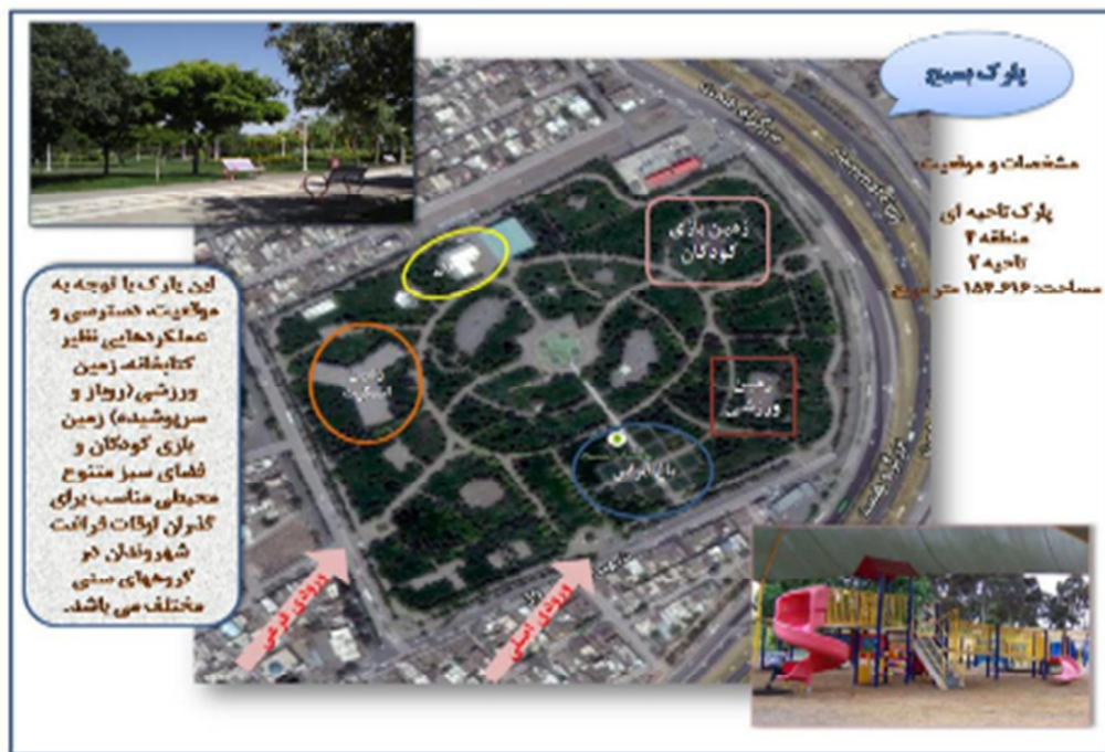
شکل (۲): موقعیت و امکانات پارک بسیج با کاربری گذران اوقات فراغت (نگارندگان)

عرضه امکاناتی برای "مشاهده طبیعت و بهره‌گیری از آواز پرندگان و صدای آبشار و ..." که معمولا برخی از افراد از آن با عنوان "همراهی با طبیعت" یاد می‌کنند، از جمله موضوعاتی است که تاکنون صدها مقاله و کتاب در ارتباط با آن به رشته تحریر درآمده است. به همین دلیل در این تحقیق نیز این انگیزه از جمله دلایل مهم برای بازدید از پارک‌ها (۵۳/۸) عنوان شده است. بدون شک این نیاز یکی از نیازهای