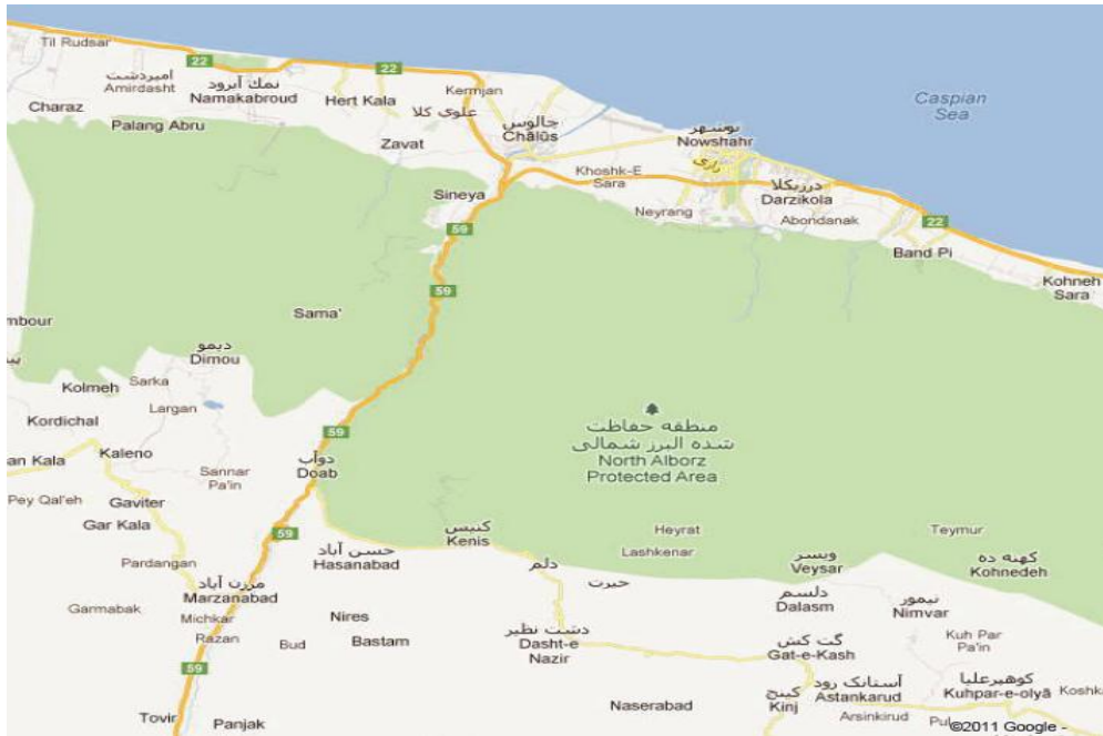
شکل (۲): عکس هوایی از شهرستان نوشهر و چالوس