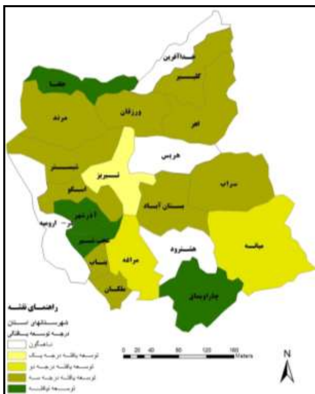
نقشه (۲): میزان توسعه یافتگی شهرستان‌های استان آذربایجان شرقی بر اساس

با تحلیل صورت گرفته در ۱۴ شخص بهداشتی-درمانی استان آذربایجان شرقی بر اساس داده‌های آماری منتشر شده در سایت سازمان آمار کشور در مقطع زمانی سال ۱۳۸۹ در روش تاکسونومی عددی، و محاسبه نسبت درجه توسعه شهرستان‌ها به جمعیت‌شان، شهرستان‌های استان آذربایجان شرقی از منظر توسعه یافتگی به پنج درجه مطابق جدول شماره ۶ طبقه‌بندی شدند. در این مقایسه کلان‌شهر تبریز به عنوان مرکز سیاسی و اداری استان، به علت بالا بودن اعتبارات اختصاصی و تملک امکانات بهداشتی-درمانی زیاد به عنوان تنها شهرستان توسعه یافته درجه یک شناخته شده و شهرستان چاراویماق که اخیراً به لیست شهرستان‌های استان افزوده شده محروم‌ترین شهرستان مشخص گردید ۱ . لذا شهرستان‌هایی مانند آذرشهر،