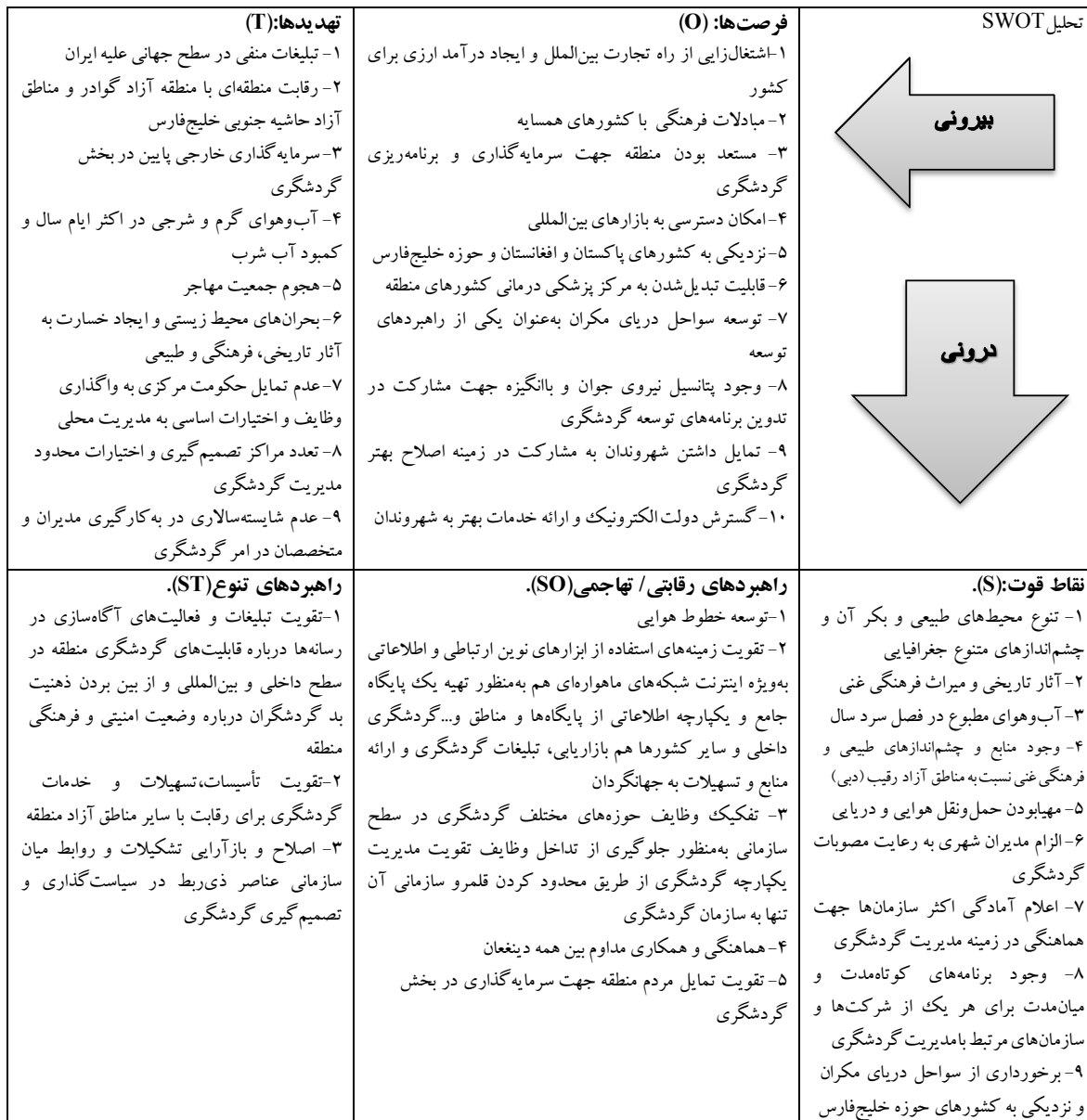
جدول (۵): تحلیل مدل SWOT