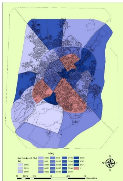
نقشه (۳): کارایی نهایی هسته‌های شهری اردبیل