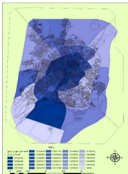
شکل (۱): نقشه فاصله هسته‌های شهری اردبیل از دیدگاه ایده آل

شهری (۲۰)، (۲۴) و (۲۲)، با ارزش ۱،۰۰۰، ۱،۱۴۶ و ۱،۵۳۶، کمترین ارزش کارایی را نسبت به دیدگاه ضدایده آل دارند. از نقطه نظر تفاوت کارایی بین \varphi_{ADMU} و \varphi_{j0} باید افزود که؛ تفاوت بیشتر بین \varphi_{ADMU} و \varphi_{j0} نشان‌دهنده عملکرد بهتر DMU_0 می‌باشد، هرچه تفاضل کارایی \varphi_{j0} از واحد مجازی ضدایده آل کمتر باشد نشانگر عملکرد ضعیف آن واحد می‌باشد. از دیدگاه ضد ایده آل، هسته‌های شهری (۵)، (۲)، (۸)، (۱۳)، (۴) و (۱۱)، با ارزش تفاضلی ۰،۹۷E+۱۰ ، ۰،۷۸E+۱۰ ، ۰،۴۸۶E+۱۰ ، ۰،۳۵E+۱۰ ، ۰،۲۱E+۱۰ و ۰،۹۰E+۹ ، بیشترین فاصله از آن دیدگاه؛ و هسته‌های شهری (۲۰)، (۲۴) و (۲۲)، به ترتیب با ارزش ۱، ۱،۱ و ۱،۵، کمترین فاصله از دیدگاه واحد تصمیم‌گیری ضد ایده آل با ارزش (۰،۰۳۹) را دارند. نقشه زیر نشان دهنده میزان فاصله هسته‌های شهری اردبیل از دیدگاه ضدایده آل می‌باشد.