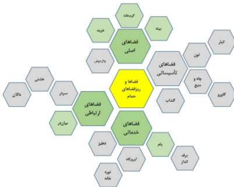
تصویر ۳. فضاها و ریزفضاهای حمام‌ها.

توضیح: موارد اشاره‌شده در سفرنامه‌ها، رنگی شده‌اند.