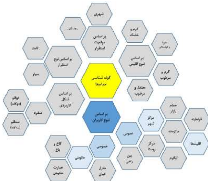
تصویر ۲. گونه‌شناسی حمام‌ها.

هستند؛ اما در خصوص معماری حمام‌ها، نمی‌توانند منابع قابل اتکایی به شمار آیند.