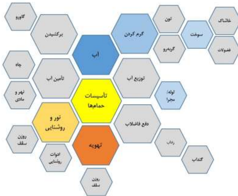
تصویر ۵. تأسیسات حمام‌ها.

توضیح: موارد اشاره‌شده در سفرنامه‌ها، رنگی شده‌اند. به علت تعدد اجزاء و عناصر معماری، همه آن‌ها در تصویر نیامده‌اند.