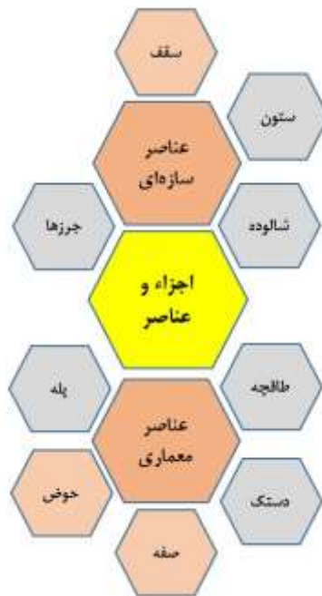
تصویر ۴. اجزاء و عناصر حمام‌ها.

توضیح: موارد اشاره‌شده در سفرنامه‌ها، رنگی شده‌اند. به علت تعدد اجزاء و عناصر معماری، همه آن‌ها در تصویر نیامده‌اند.