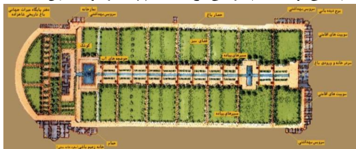
نمودار ۲. پلان شماتیک باغ شاهزاده ماهان

در دید اولیه بعد از ورود به باغ پلکانی بودن باغ به چشم می‌آید. هر سطح به صورت ۱۲ سطح پلکانی به همراه آبشارها، دو حوضچه و فواره‌هایی که دور تا دور آن با درختان بلند قامت پوشیده شده، شکل گرفته است. پلکانی بودن در باغ شاهزاده ماهان، آب را در تمام طول باغ حرکت می‌دهد. آبی که در این باغ حرکت دارد، از رودخانه تیگران تامین می‌شود، که از ارتفاعات کوه جوپار سرچشمه می‌گیرد. حرکت آب علاوه بر زیبایی بصری، پوشش گیاهی اطراف را هم سیراب می‌کند و سپس به سوی بیرون باغ جاری می‌شود. سیستم آبرسانی باغ