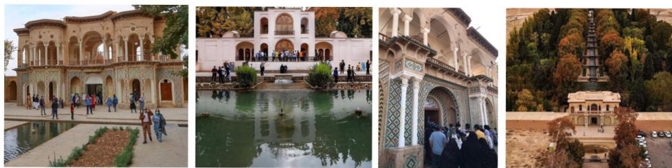
شکل ۱. باغ شاهزاده ماهان (مأخذ: نگارندگان)

باغ شاهزاده در ۳۵ کیلومتری جنوب شرقی کرمان و در دامنه شمالی کوه جوپار در حاشیه شهر ماهان واقع شده است. این