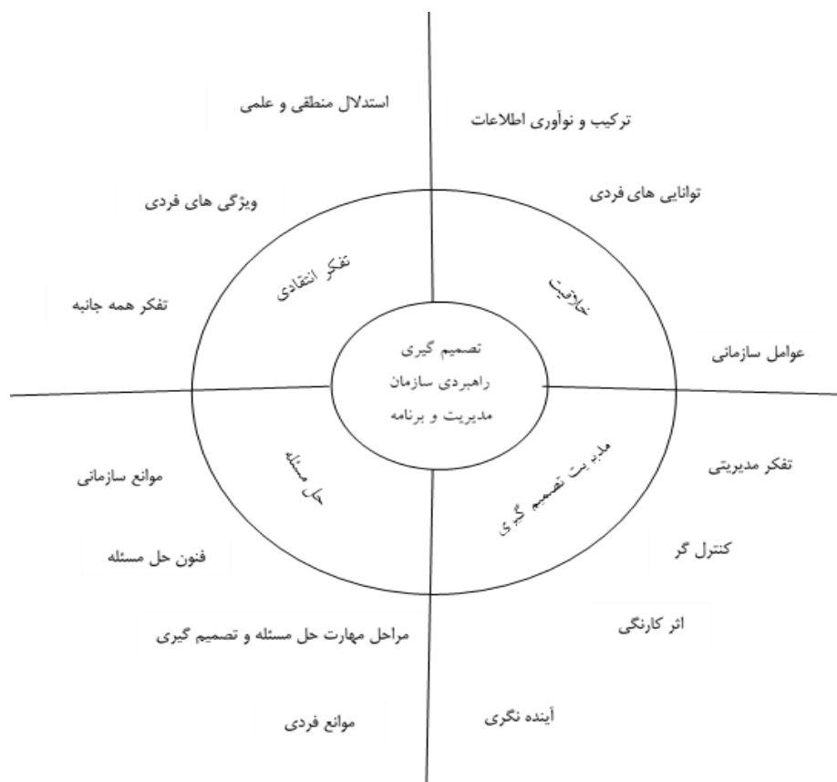
شکل شماره (۲) مدل نهایی تحقیق