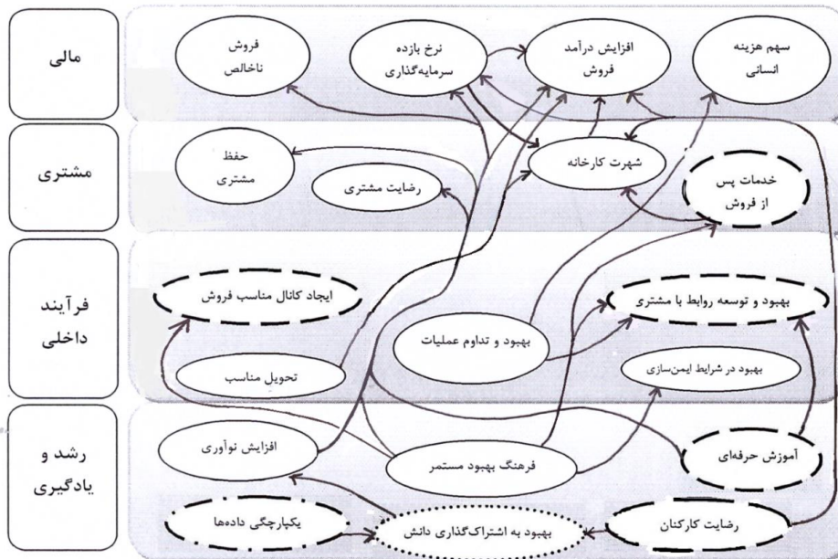
شکل شماره ۴. تحلیل IPA در نقشه استراتژی شرکت ایران خودرو مازندران

همکاران ۱ ، ۲۰۱۳؛ کوزادا و اسپینا، ۲۰۱۴). به این ترتیب علی‌رغم مطالعات انجام شده، مسأله مهم فقدان رویکرد سیستماتیک برای توسعه روابط متقابل پیچیده در طراحی یک نقشه استراتژی است؛ از طرفی دیگر تقریباً در هیچ یک از مطالعات صورت گرفته در زمینه نقشه استراتژی، عملکرد اجزای نقشه استراتژی تحلیل نشده است. از این رو مزیت قابل توجه این پژوهش با دیگر مطالعات پیرامون نقشه استراتژی، ارائه نتایج تحلیل اهمیت- عملکرد در نقشه استراتژی و شناسایی فرصت‌های مناسب برای تخصیص منابع جهت تحقق اهداف استراتژیک با اولویت بالاتر می‌باشد (شکل ۴). از آنجاییکه شرکت‌ها با منابع محدود روبرو هستند نتایج اولویت‌بندی این تحلیل می‌تواند رهنمودهای لازم را برای مدیریت فراهم کند تا مدیران تلاش‌های خود را در بخش‌های مهم و اولویت‌دار متمرکز کنند.