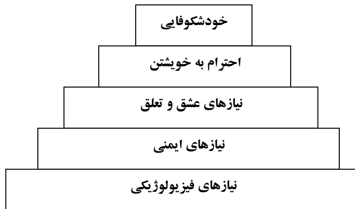
شکل سلسله مراتب نیازها (اقتباس از ساعتچی، ۱۳۸۸)

الف) نظریه سلسله مراتب نیاز مازلو: مازلو معتقد است که آدمی به طور مداوم و پیوسته در حال برانگیختگی است و فقط برای مدت کوتاهی می تواند به ارضای کامل نیازها برسد وقتی یک نیاز ارضا شد، نیاز دیگری جای آن را می گیرد و می توان نیازها را به صورت سلسله مراتب و به ترتیب تقدم و تأخر و مانند یک هرم نشان داد (ساعتچی، ۱۳۸۸).