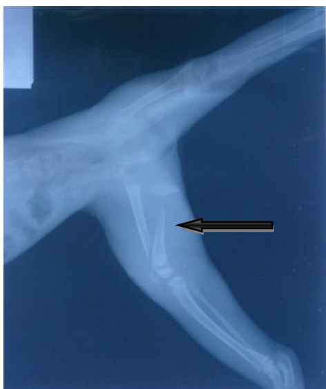
شکل ۱ شکستگی مورب بلند استخوان ران پای راست، نمای میانی-جانبی

شکل و نوع شکستگی استخوان مرتبط است. روش‌هایی همچون پین‌های داخل مدولا استخوان به همراه سیم-های استخوانی، پین داخل مدولا همراه با تثبیت خارجی استخوان، تثبیت خارجی استخوان به تنهایی و پلیت‌های استخوانی به منظور ترمیم شکستگی بدنه استخوان ران استفاده می‌گردد (Johnson, 2007). تثبیت شکستگی با استفاده از پین و سیم ارتوپدی در شکستگی‌های مورب بلند بدنه استخوان ران یکی از روش‌های معمول می-باشد (Harasen, 2003). گزارش حاضر درمان شکستگی مورب بلند استخوان ران ناشی از ضربه بوده و اهمیت آن درمان جراحی به روش تثبیت داخلی پین داخل مدولا به همراه سیم ارتوپدی در گونه حیوانی میمون به دلیل وزن‌گیری بیشتر بر روی دوپا می‌باشد.