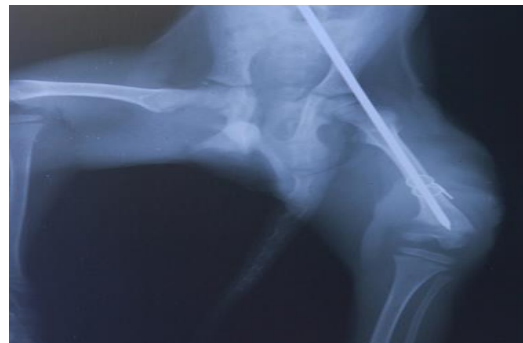
شکل ۵- رادیوگرافی متعاقب تثبیت داخلی شکستگی، نمای جانبی-میانی

(Johnson, 2007; Harasen, 2003). بررسی‌های مختلف انجام شده در بین میمون‌ها و انسان، نشان داده است که بازسازی قشر استخوان میمون نسبت به انسان آهسته‌تر می‌باشد، هرچند که این میزان در گونه‌های مختلف متفاوت است (Jarrell, 2011). به منظور ترمیم شکستگی‌ها نیاز به تثبیت و بی‌حرکت‌سازی استخوان می‌باشد. استفاده از آتل و یا گچ‌گیری به عنوان تثبیت خارجی به دلیل عدم ثبات کامل خط شکستگی در برابر نیروهای استخوانی در شکستگی‌های مورب بلند مناسب نمی‌باشد (Johnson, 2007). از معمول‌ترین درمان‌ها به روش جراحی در شکستگی‌های مورب بدنه استخوان ران، استفاده از پین به همراه سایر روش‌های کمکی از جمله تثبیت کننده‌های خارجی و یا سیم‌های ارتوپدی برای خنثی کردن نیروهای خم‌کننده و چرخشی استخوان می‌باشد (Johnson, 2007).