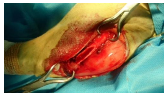
شکل ۳- شکستگی مورب بلند استخوان ران پای راست