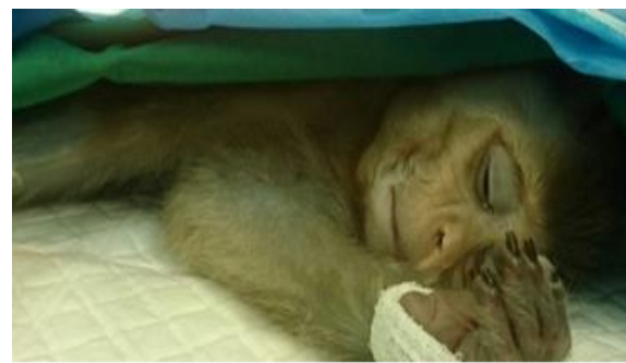
شکل ۲- آماده‌سازی و بیهوشی بیمار