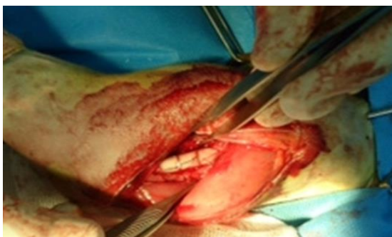
شکل ۴- اصلاح شکستگی مورب بلند استخوان ران با روش پین و سیم ارتوپدی

پس از تایید بیماری و موافقت صاحب بیمار اقدام به انجام جراحی شد. بیمار به مدت ۱۲ ساعت از مصرف غذا و ۶ ساعت از نوشیدن آب منع گردید. پس از برقراری مسیر وریدی، پیش‌بیهوشی از طریق تزریق داخل عضلانی ترکیب داروی مدتومیدین (لابراتوار سیوا، سو-اسپانیا) با دز ۰/۱ میکروگرم به ازای هر کیلوگرم وزن بدن و کتامین هیدروکلراید (آلفاسان، وردن-هلند) با دز ۷ میلی‌گرم به ازای هر کیلوگرم وزن بدن القاء شد. سپس بیهوشی با تزریق داخل وریدی ترکیب داروی کتامین هیدروکلراید با دز ۷ میلی‌گرم به ازای هر کیلوگرم وزن بدن و دیازپام (کاسپین تمین فارماسپتیکال، رشت-ایران) با دز ۰/۲۷ میلی‌گرم به ازای هر کیلوگرم وزن بدن برقرار گردید. بیهوشی با مقادیر مذکور و فواصل ۱۰ دقیقه‌ای ادامه یافت. محلول رینگر لاکتات به میزان ۲۰ میلی‌لیتر به ازای هر کیلوگرم وزن بدن به ازای هر ساعت تجویز گردید. سفازولین