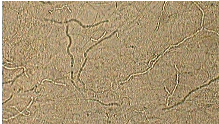
شکل ۲- هایف‌های بلند و واجد دیواره عرضی درماتوفیتی به همراه آرتروکنیدی‌ها در نمونه میکروسکوپی مستقیم تهیه‌شده با هیدروکسید پتاسیم/دی‌متیل سولفوکساید ۲۰ درصد.