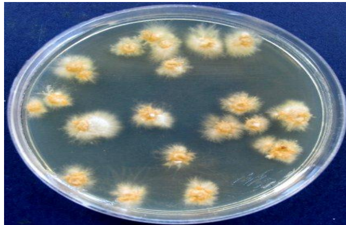
شکل ۳- خصوصیات مورفولوژیکی تریکوفیتون وروکوزوم روی محیط سابورو دکستروز آگار: به کلونی‌های کوچک دکمه‌مانند به رنگ سفید تا کرم، سطحی با قوام مخملی توجه نمایید.