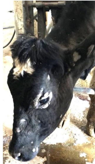
شکل ۱- ضایعات درماتوفیتوز در گوساله ۶ ماهه (تصویر سمت راست) و گاو شیری (تصویر سمت چپ). به ضایعات ضخیم، مجزا و دلمه‌های سفید متمایل به خاکستری در اطراف چشم‌ها، پوزه و گوش‌ها توجه کنید.