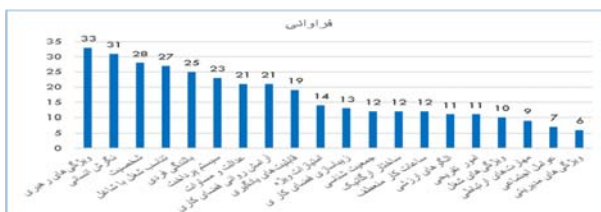
شکل (۳): رتبه بندی عوامل موثر بر نشاط کارکنان دانشی