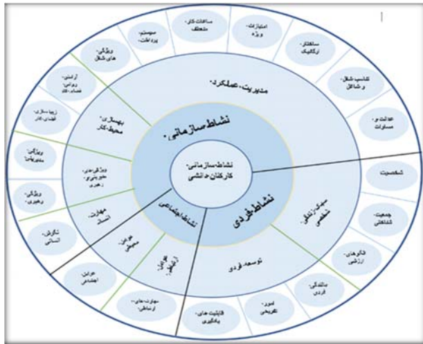
شکل (۲): مدل نشاط سازمانی کارکنان دانشی در صنعت بانکداری خصوصی (منبع: یافته های پژوهشگر)

بود، دسته بندی و در قالب مدل نشاط سازمانی کارکنان دانشی در صنعت بانکداری به شرح شکل ۱ ارائه گردید.