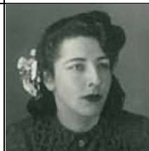
ایران دختر تیمور تاش