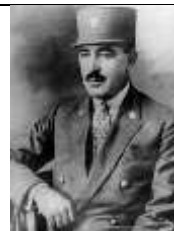
تیمور تاش وزیر دربار