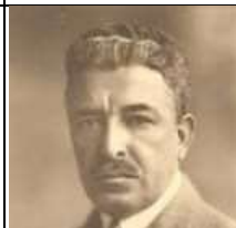
تیمور تاش در اواخر عمر