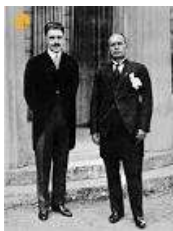
موسولینی و تیمور تاش