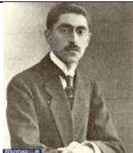
نصرت الدوله فیروز