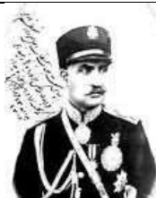
رضا شاه پهلوی