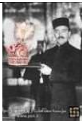
تیمور تاش حامل تاج پهلوی اول