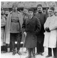
رضا خان در کنار احمد شاه