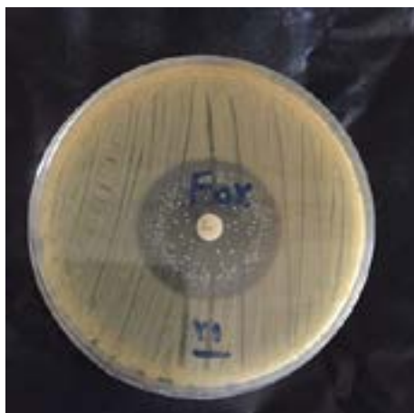
شکل ۱ - تصویر دیسک آنتی بیوتیک سفوکسیتین جهت تعیین سویه های MRSA.

جنتامایسین ۲۰٪ (۱۰ سویه)، سیپروفلوکساسین ۱۶٪ (۸ سویه) و ریفامپین ۴٪ (۲ سویه) دیده شد. بر اساس نتایج از ۵۰ سویه مورد مطالعه، ۲۰ سویه (۴۰٪) مقاوم به متی-سیلین تشخیص داده شد. این سویه ها شماره ۳-۷-۱۱-۱۳-۱۴-۲۵-۲۰-۲۳-۲۶-۲۹-۳۰-۳۲-۳۶-۳۷-۳۹-۴۱-۴۳-۵۰-۴۹-۴۶ می باشند. بنابراین برای ادامه کار، این سویه از بین ۵۰ باکتری جدا شد و بقیه مراحل بر روی این ۲۰ سویه انجام شد.