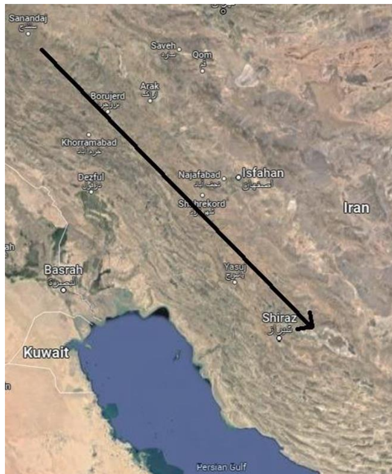
Figure 2: the migration route of Parsuans (Persians) from the Central Zagros to Southern Zagros.

199: Sennacherib 23, v 35-42; 223-224: Sennacherib 34, 44b-47a & 231: Sennacherib 35. 40'b-43'; and 2014: 194: Sennacherib 144, i 3'-7'a & 198-199: Sennacherib 146, 15-16), the first destination (around Lake Bakhtegan?) was in the east of Anshan. This suggests that the migration was done with the full cooperation of the king of Elam. Particularly considering that the new Parsuaš / Parsumāš was seen as an ally for the Elamites from that date onwards. According to Ashurbanipal, Parsumāš was located in the east of Elam (Novotny & Jeffers, 2018: 307: Ashurbanipal 23: 114-117) without mentioning Anshan (was it captured by the Persians before that date?). It gives us a clear understanding that Parsumāš was situated in the east of Tell Malyan (Anshan) and in the basin of Lake Bakhtegan (Fig. 2).