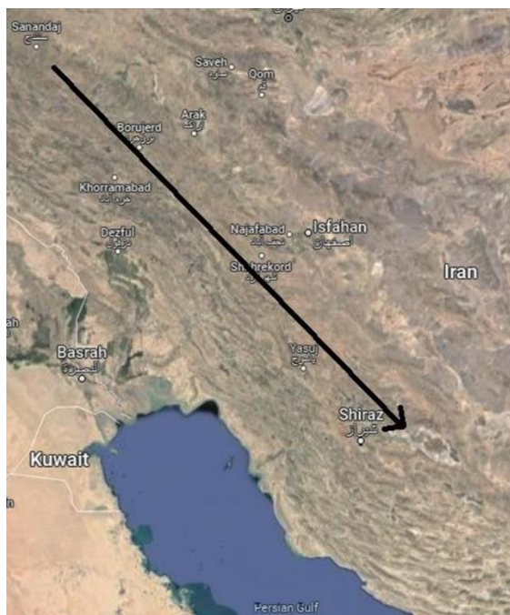
شکل ۱: مسیر مهاجرت گروهی اهالی پرسوا (پرسو، پرسواش، پرسومش) از زاگرس مرکزی به زاگرس جنوبی.

پیشروی تیگلات-پیلسر به سمت شهر نیکور ( URU.ni-kur ) (شهری در پرسوا) که شهر مستحکم تونکو خوانده شده است، موجب گریز شخص اخیر از آن سرزمین و رها کردن قلمرواش شد. شاه آشور چنین نوشته است که او نیکور را به آتش کشید، سپس آن را به همراه شهرهای پیرامونش بازسازی کرد و مردمانی از دیگر سرزمین‌ها را در آن جا نشانده و این گونه، ترکیب جمعیت را بر هم زد. در انتها او نوشته است که خواجه‌ای از خود را به عنوان فرماندار ( LÚ.EN.NAM ) در آن جا گمارد و این چنین، استقلال سیاسی پرسوا از دست رفت (Tadmor & Yamada, 2011: 29: Tigl. III 6, ) (7-10b & 31: Tigl. III 7, 3b-6a)؛ نکته‌ای که کارن رادنر به خوبی به آن اشاره کرده است (Radner, 2006: 57). پیشین در نزدیکی پرسوا گزارش کرده است (ibid.: 280-281: Sargon II 65, 37-38b & 51). همچنین پیرو بخشی از نبشته ۶۵، سارگن آشکارا خواجه دست‌نشانده خود در پرسوا/پرسواش را صاحب اختیار دو شهر اَپتر ( URU.ap-pa-tar ) و کیتیت ( URU.ki- ) در حدود گیزیلوند ( it-pat-a-a ) معرفی کرده است که این موضوع به خوبی گسترده‌گی قلمروی اختیارات خواجه حاکم بر پرسواش را نشان می‌دهد (ibid.: 282-283: Sargon 65, 70-73) (شکل ۱).