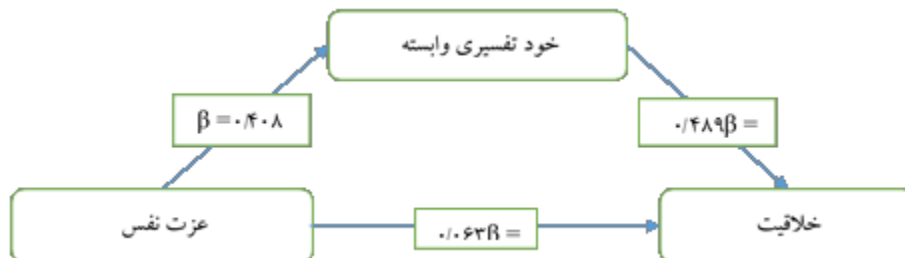
شکل ۳. دیاگرام مسیر را نشان می دهد