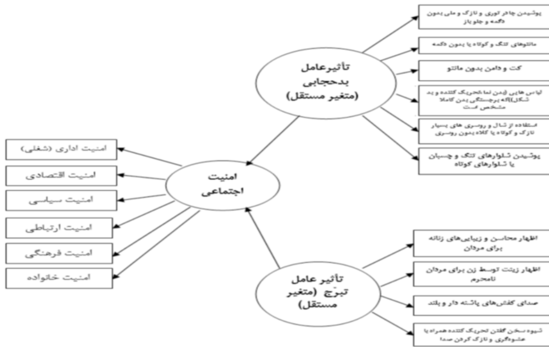
نمودار ۳. تأثیر تبرج و بدحجابی بر امنیت اجتماعی

در تفاوت حیاء زن و مرد، امام صادق علیه السلام می‌فرماید: «حیاء ده جزء است که نه جزء آن در زنان و یک جزء آن در مردان است» (Majlisi, 1983). همچنین می‌فرمایند: «خداوند برای زن، صبری معادل صبر ده مرد قرار داده است، و آنگاه که حمل بردارد، قدرت ده مرد دیگر را نیز به وی می‌دهد» (Majlisi, 1983)؛ و از ایشان روایت شده: «به زنان نیروی مباشرت (ارتباط جنسی) دوازده نفر و صبر دوازده نفر عطا شده است» (Kolini, 1986)؛ با استناد به اینگونه روایات، چنین به دست می‌آید که توان جنسی زن بر مرد برتری دارد و در مقابل، حیاء و صبر او نیز بیشتر است. از این رو اسلام حیا و عفاف را ارزش گوهر وجودی زن می‌داند و آن را موجب تکریم شخصیت زن در نظر دیگران می‌شمارد. «دستورات دینی مانند حجاب، روابط محرم و نامحرم و... به خاطر حفظ عفاف زن و مرد است. البته عفاف فقط مختص زنان نیست؛ بلکه مردها هم باید عقیف باشند تا جامعه سالم بماند. بنابراین رکن اصلی در هر برنامه‌ریزی مربوط به دختران، باید براساس رعایت و حفظ حیاء و عفاف آنان باشد» (Hosseini, 2006). این روایات و سفارشات دین، معلوم می‌سازد که باید تمرکز و تأکید نظام آموزشی در تقویت حیورزی در دختران پررنگ‌تر از پسران باشد و حصول این امر با تدوین محتوای یکسان آموزشی، منطقی به نظر نمی‌رسد.