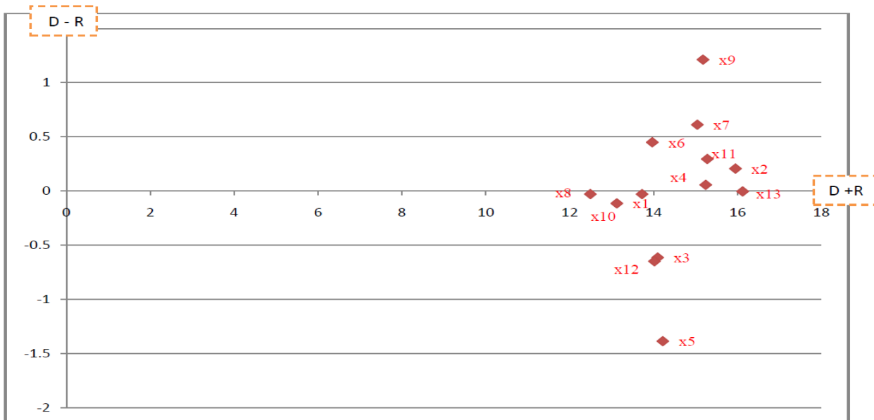
نمودار ۱- نقشه روابط علت و معلول

پس از رسم نقشه روابط و تقسیم بندی شاخصها به دو گروه اثرگذار(گروه علت) و اثرپذیر (گروه معلول) و تعیین اثرگذارترین و اثرپذیرترین شاخصها در مرحله قبل، در این مرحله به تعیین وزن هر یک از شاخصها با کمک روش ANP می پردازیم. جدول نهایی وزن هر یک از شاخصها در جدول(۸) ارائه گردیده است: