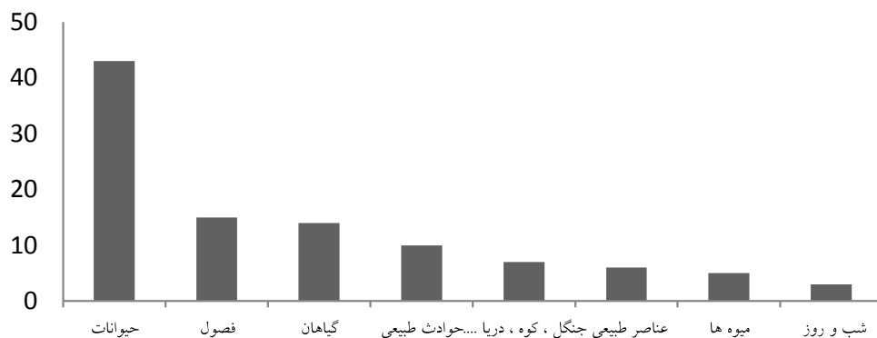
شکل ۴-۱: اجزای تشکیل‌دهنده اشعار با مضامین طبیعت‌گرا

در بین عناصر طبیعی، بیشترین توجه شاعران در دهه هشتاد به حیوانات (۴۳/۳ درصد) و کمترین توجه به شب و روز (۲/۸ درصد) بود. شکل (۴-۱)، درصد اشعار سروده‌شده در بین عناصر طبیعی را نشان می‌دهد.