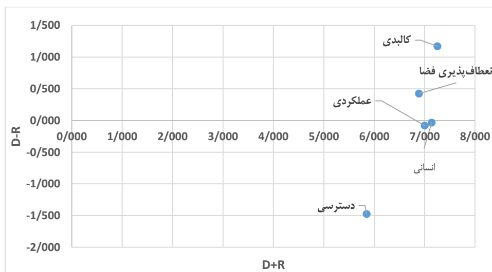
شکل ۳- وضعیت معیارها در نمودار نتایج مدل دیمتل

با توجه به نتایج جدول شماره ۱۵، مولفه کالبدی با مقدار (D) ۴/۲۱۲ تأثیرگذارترین مولفه، مولفه دسترسی با مقدار (R) ۳/۶۶۳ تأثیرپذیرترین مولفه و مولفه کالبدی با مقدار (D+R) ۷/۲۵۵ بیشترین ارتباط را با سایر معیارها به دست آورده است. همچنین برای بررسی علت و معلولی معیارها به ترسیم نمودار دیمتل پرداخته شده است که نتایج این ترسیم در شکل ۲ نشان داده شده است: