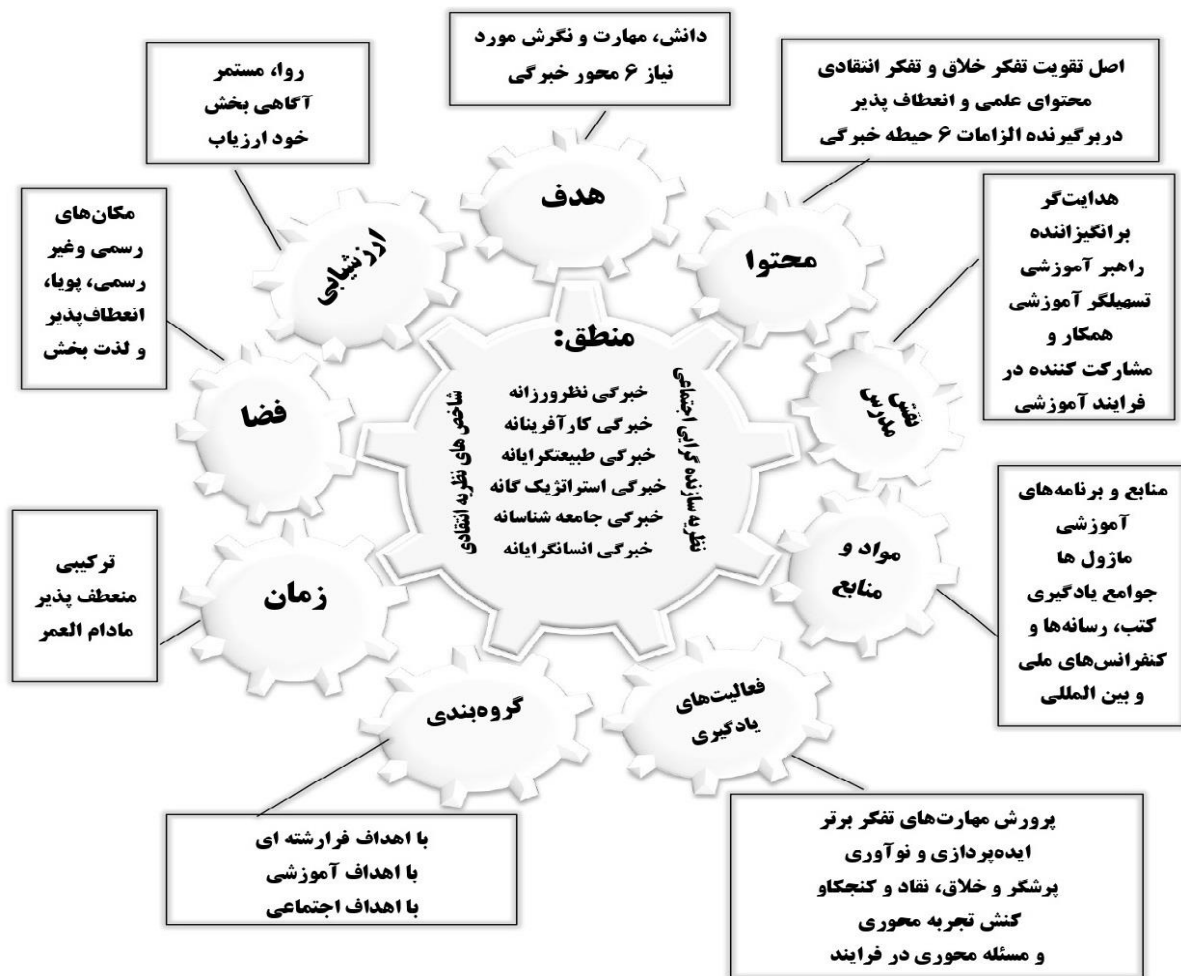
شکل 2: الگوی مطلوب برنامه درسی گردشگری پایدار

پژوهش قابل انجام می‌باشد. همچنین با توجه به معنی-داری آزمون بارتلت ( P < 0/05 )، فرض همانی بودن ماتریس همبستگی رد شده و تحلیل عاملی برای شناسایی ساختار(مدل عاملی) مناسب است. پس از تعیین مناسب بودن مدل عاملی، ابتدا همبستگی بین شاخص‌ها مورد بررسی قرار گرفته که بر اساس نتایج عناصر روی قطر اصلی همگی یک هستند و ماتریس همبستگی متقارن می‌باشد. میزان اشتراکات بعد از استخراج عامل‌ها برای همه متغیرها بیشتر از 50 درصد (از حداقل 0/500 تا 0/695) و بیانگر توانایی آن‌ها در تبیین واریانس متغیرهای مورد مطالعه در پژوهش بودند. هر 10 عامل استخراج شده در بخش کیفی دارای مقادیر ویژه بالاتر از یک بودند که 57/823 درصد از کل