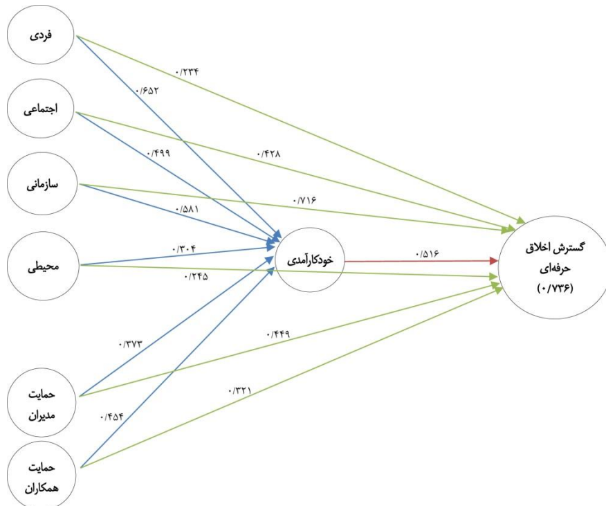
شکل ۲- رابطه متغیرهای پژوهش و اثر متغیر واسطه‌ای

از آنجا که آلفای کرونباخ تمامی متغیرها بزرگتر از 0/7 است، بنابراین، از نظر پایایی تمامی متغیرها مورد تأیید است. مقدار میانگین واریانس استخراج شده نیز بزرگتر از 0/5 است، بنابراین، روایی همگرا نیز تأیید می‌شود. مقدار روایی مرکب نیز در حد مطلوب و بالاتر از 0/7 است. رابطه متغیرهای مورد بررسی در هر یک از فرضیه‌های پژوهش براساس یک ساختار علی با فن حداقل مربعات جزئی PLS آزمون شده است. الگوی کلی پژوهش نیز در شکل ۱ ترسیم شده است. همچنین، الگوی اندازه‌گیری (رابطه هر یک از متغیرهای قابل مشاهده با متغیر پنهان) و الگوی مسیر (روابط متغیرهای پنهان با یکدیگر) نیز محاسبه شده است. برای سنجش معناداری روابط نیز آماره t با روش بوت استرپ محاسبه شد که در شکل ۲ آمده است. در این الگو خلاصه یافته‌های مربوط به بار عاملی استاندارد روابط متغیرهای پژوهش ارائه شده است. آزمون فرضیه‌های پژوهش براساس روابط هر یک از متغیرها به تفکیک نیز آمده است. در ادامه، شکل ۲ و ۳ یافته‌های مربوطه را نشان می‌دهد.