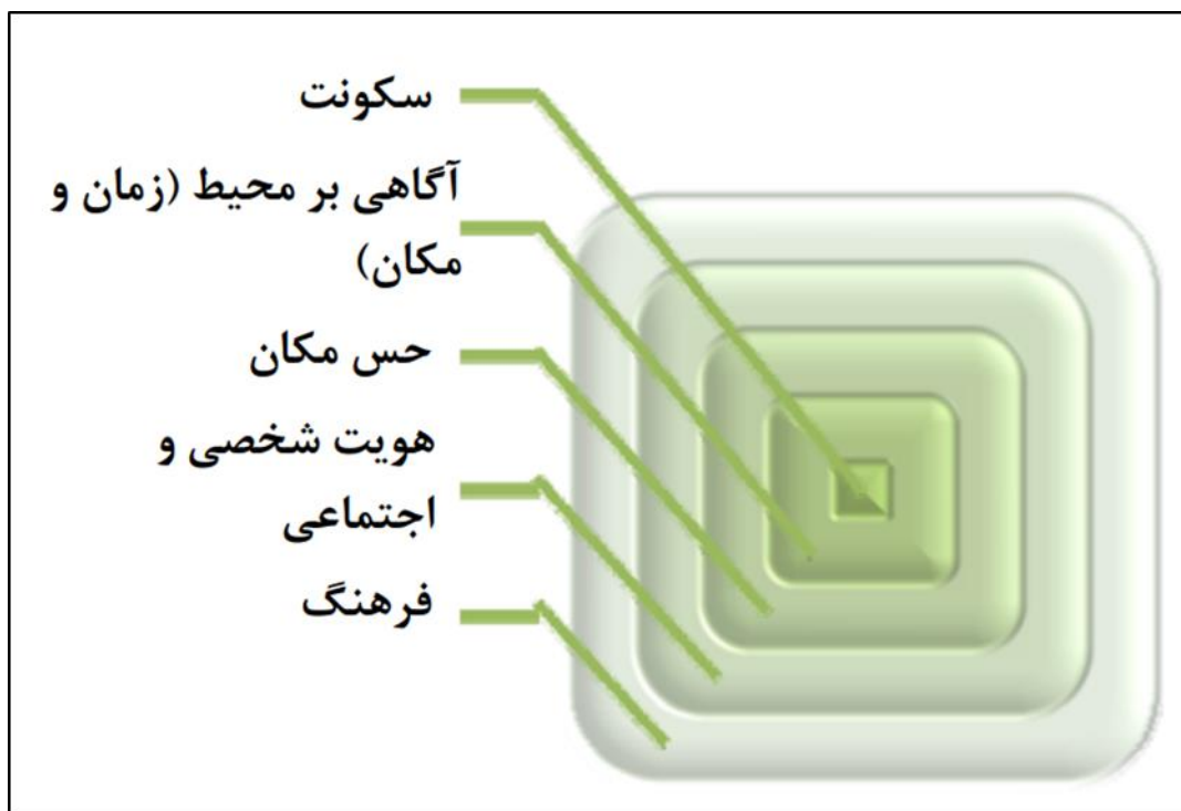
شکل ۲: تاثیر متقابل فرهنگ و سکونت‌گزینی