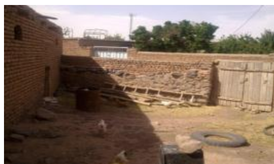
شکل ۳: طویله و محل نگهداری دام در روستای کورگه