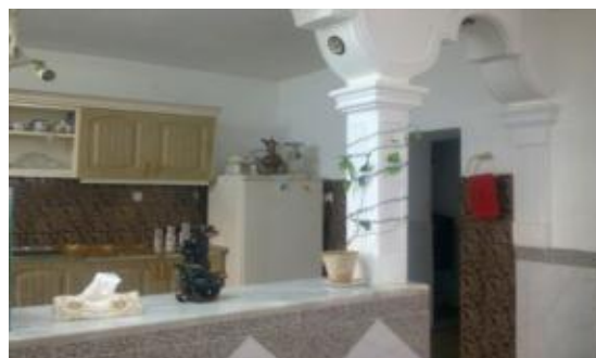
شکل ۴: فضای آشپزخانه در روستای ملک آباد