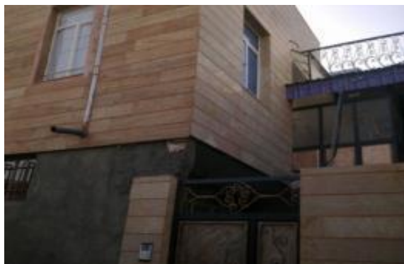
شکل ۵: نمای خانه‌های سنگی در روستای حافظ آباد