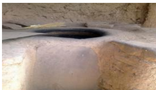
شکل ۲: تنور گلی در روستای دهنو