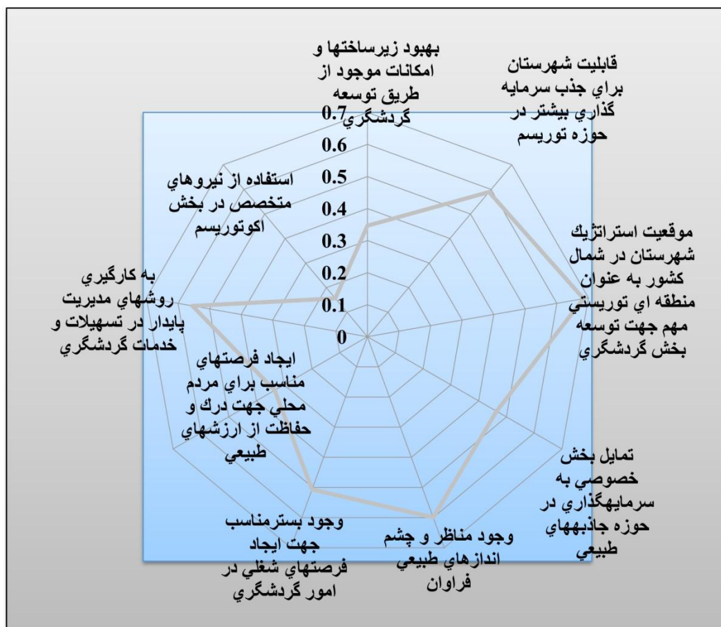
نمودار شماره (۱): رتبه بندی معیارها بر اساس مدل تاپسیس