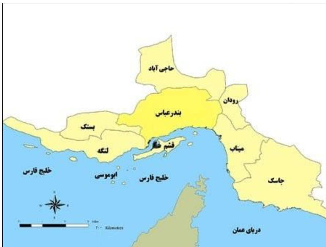
نقشه ۲: موقعیت شهرستان بستک در استان هرمزگان