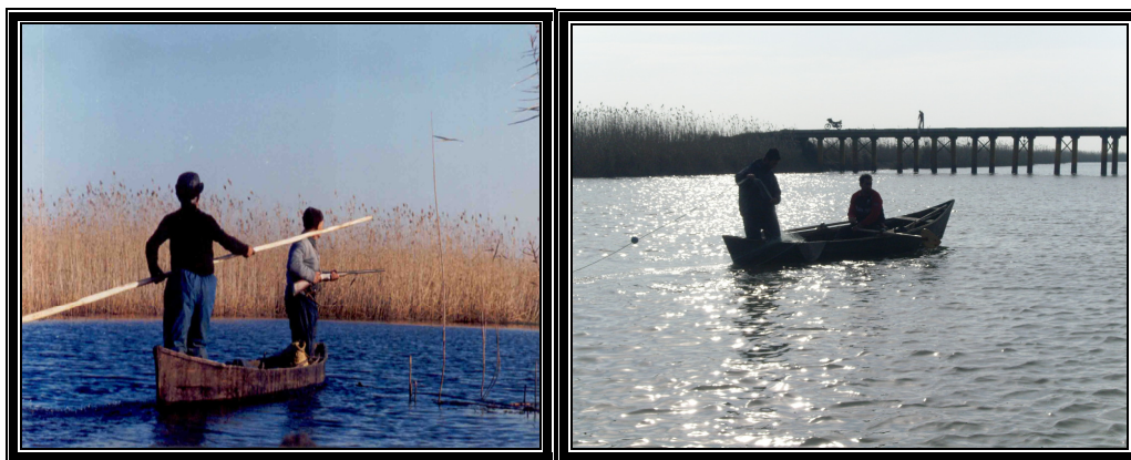
عکس شماره ۷ و ۸- شکار و صید انواع ماهی‌های تالابی برای معیشت ۴ فصل حاشیه‌نشینان تالاب انزلی