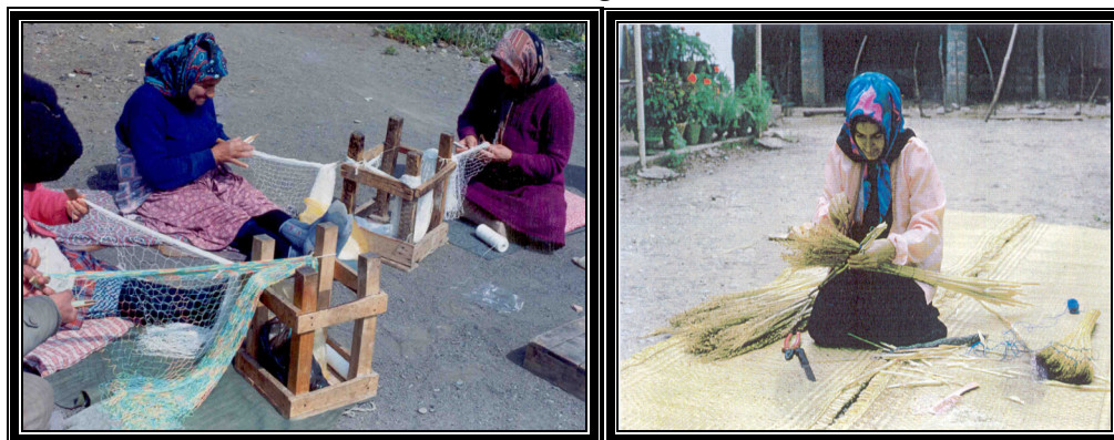
عکس شماره ۹ و ۱۰- نمونه‌ای از صنایع دستی وابسته به تالاب انزلی (زنان روستایی)