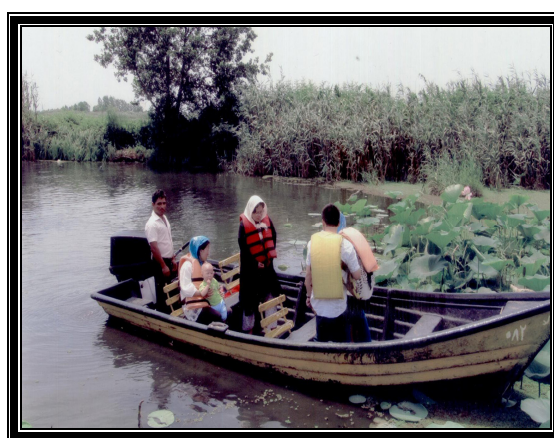
عکس شماره ۲ او - لاله دریایی یکی از دیدنی‌های منحصر به فرد تالاب انزلی و قایقرانی تفریحی (گردشگری)