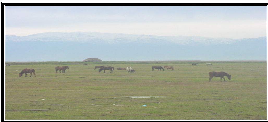
عکس شماره ۶- فرق محلی برای نگهداری انواع دام‌های بزرگ در حاشیه تالاب انزلی