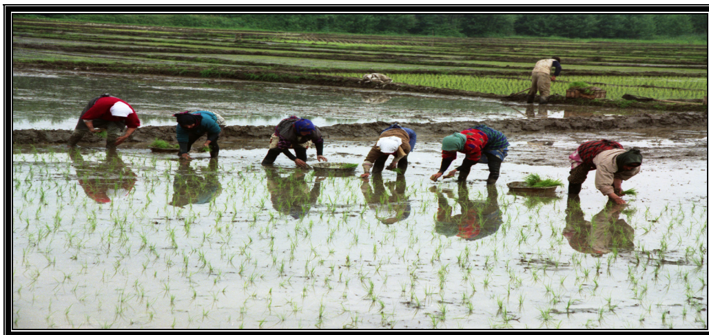
عکس شماره ۵- شالیزارهای روستاهای حاشیه تالاب انزلی

الف: اثرات مثبت: سالم‌سازی و سالم نگه‌داشتن این نگین کم‌نظیر در حفظ و حراست، چشم‌انداز طبیعی آن - استفاده بهینه و به موقع از فرآورده‌های تالاب از قبیل صید ماهی - شکار پرندگان - برداشتن