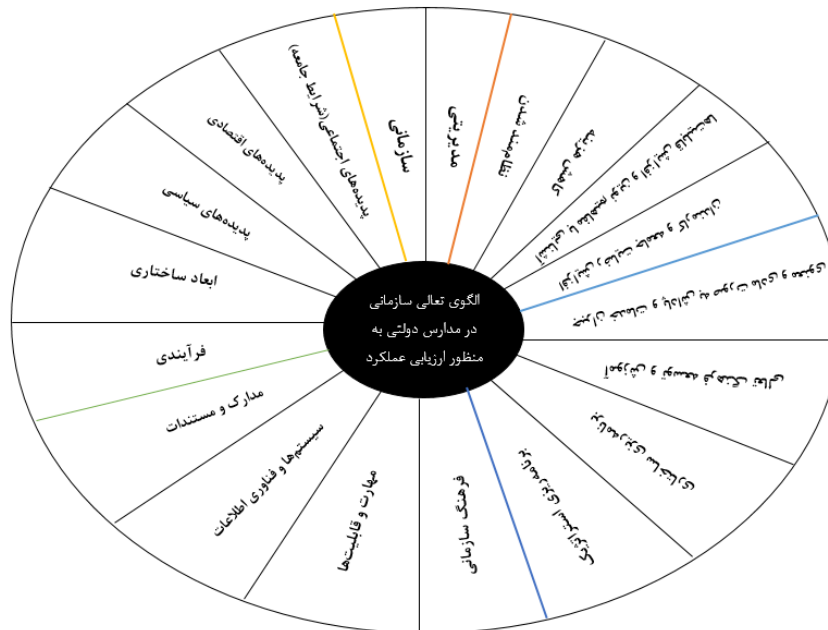
شکل ۳. مدل مفهومی مدیریت تعالی سازمانی به منظور ارزیابی عملکرد مدارس دولتی شهر تهران

نتایج شکل ۱ و ۲ بیانگر تایید تاثیر تمام مولفه‌ها و شاخص‌ها بر روی مدیریت تعالی سازمانی به منظور ارزیابی عملکرد مدارس دولتی متوسطه شهر تهران است.