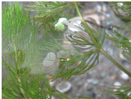
تصویر ۳- مشاهده توده تخم حلزون لیمنه آ گدروزیانا در آزمایشگاه موسسه سرم سازی رازی (نمونه‌های صید شده)

بر اساس اطلاعات موجود در اغلب مناطق ایران گونه‌های مختلفی از حلزون‌های آب شیرین گزارش شده است. (۴). در سال ۱۳۷۲ در مطالعه توزیع جغرافیای حلزون‌های خانواده لیمنه ایده در ایران ۷ گونه ترانکاتولا، پالوستریس، استاگنالیس، پرگرا، گدروزیانا، روفنس و اوریکولاریا شناسایی و گزارش نمود. در گزارش کریمی و همکاران در سال ۲۰۰۴ از شهرستان شادگان در استان خوزستان و منصوریان در سال ۱۳۷۲ از سراسر ایران به جز استان لرستان گونه لیمنه آ گدروزیانا را به عنوان گونه غالب گزارش کرده‌اند. پراکندگی حلزون‌های آب شیرین طی یک دوره زمانی معین در زیست گاه‌های خاص بر حسب خصوصیات ریخت شناختی بیوشیمیایی و فیزیکی تغییر می کنند. در مطالعه منصوریان بر روی شکم پایان دوزیست استان کرمانشاه در غرب ایران در سال ۱۳۷۹ از حلزون لیمنه ایده سه گونه شناسایی و گزارش شد. در مطالعه مولوی و همکاران (۱۳۸۸) در استان خوزستان از ۷ گونه حلزون آب شیرین شناسایی شده ۲ گونه لیمنه آ ترانکاتولا و لیمنه آ گدروزیانا با کمترین فراوانی گونه‌ای گزارش کرد. صلاحی مقدم و مسعود (۱۳۸۷) جمعیت حلزون لیمنه آ گدروزیانا را از استان مازندران در فصل گرم سال بیشتر گزارش کردند و میزان وفور جمعیت این گونه در پاییز و زمستان به صفر می‌رسد. در استان لرستان شهرستان بروجرد هم دقیقاً لیمنه آ گدروزیانا در فصل گرم بیشتر گزارش شد. یافته‌های لیمنه آ ترانکاتولا در استان لرستان، شهرستان