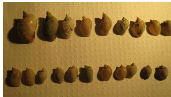
تصویر ۱- نمونه‌های اندازه گیری شده صدف حلزون‌های لیمنه آ گدروزیان در موسسه سرم سازی رازی

از نظر میزان پراکنش، فیزا آ کوتا بیشترین ۴۸۴ (۴۰/۳۳٪) و لیمنه آ استاگنالیس کمترین ۳۶ (۳٪) میزان فراوانی را نشان داد و سایر جنس‌ها شامل لیمنه آ گدروزیان ۳۸۵ (۳۲/۰۸٪)، لیمنه آ اوریکولاریا ۱۸۳ (۱۵/۲۵٪)، لیمنه آ ترونکاتولا ۷۴ (۶/۲۵٪) و بی تینیا ۳۷ (۳/۰۸٪) مشاهده شد.